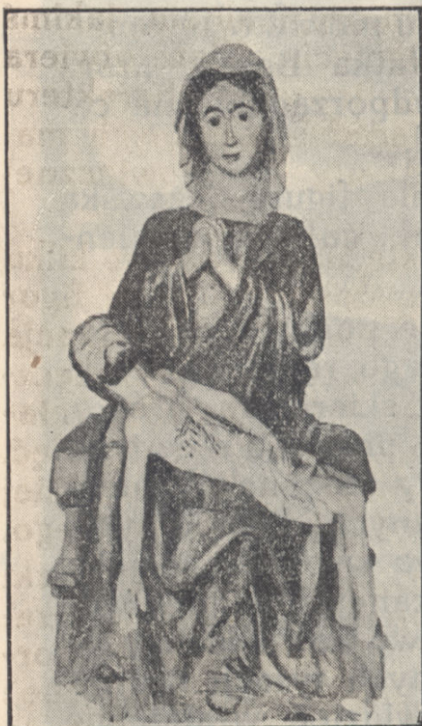
„Pietà“ w Jeżewie.

(Wlkp.), w Skrzetuszu (po niem. Schrotz, na terytorjum dziś niemieckiem, pod Piłą), na Zdieszu w Borku (w kościele poklasztornym) i wreszcie nie dawno temu przez autora odnalezioną „pietà“ w Sobiałkowie 1) w pow. rawickim.