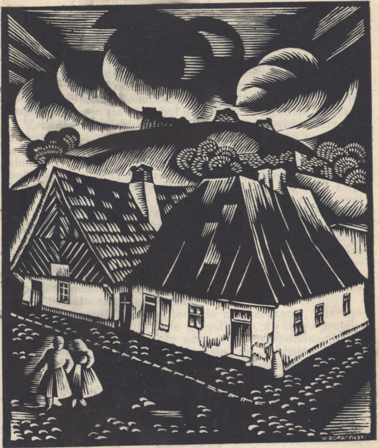
Widok dawnego Gostynia.

Specjalnie dla Kroniki wykonał Wacek Boratyński.