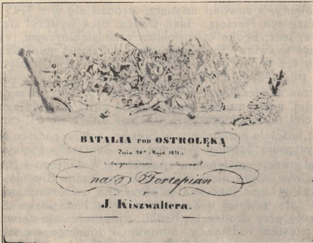
Karta tytułowa Batalji pod Ostrołęką.