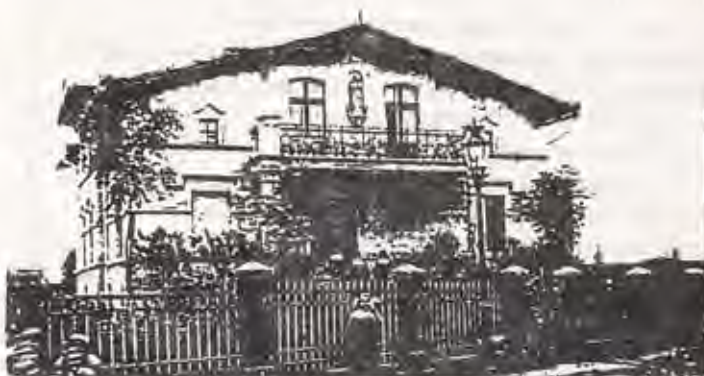
Zdjęcie wykonane ok. roku 1910.

Jeden z domów znajduje się w Krzywinu na ulicy Świerczewskiego(?)