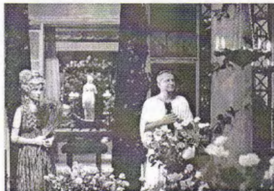
Kazimierz Morawski był przewodnikiem Henryka Sienkiewicza po antyku