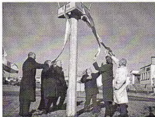
Otwarcie ronda im. Melchiora Wańkowicza w Jerce