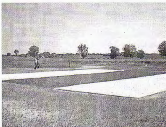
Wysypisko odpadów w Świńcu