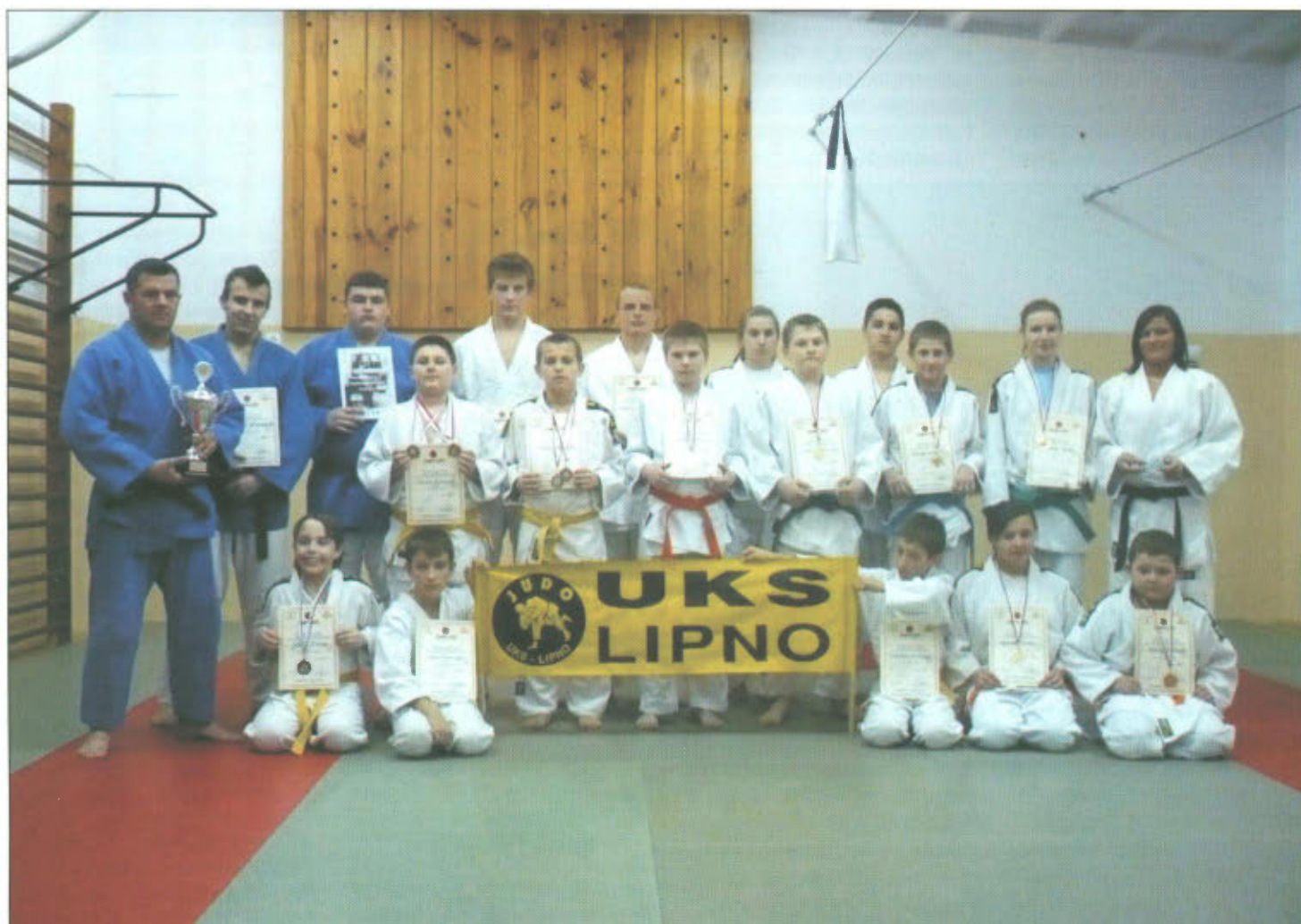
Po zimowym obozie judocy UKS Junior Lipno z powodzeniem rywalizują na krajowych i zagranicznych zawodach. Obszerne relacje ze startów sportowców Junióra znajdują się na stronie 9