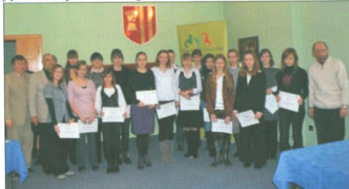
Uczestnicy konkursu wraz z jury i organizatorami