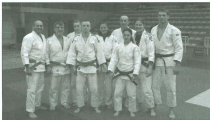
Polscy judocy na matach w Paryżu