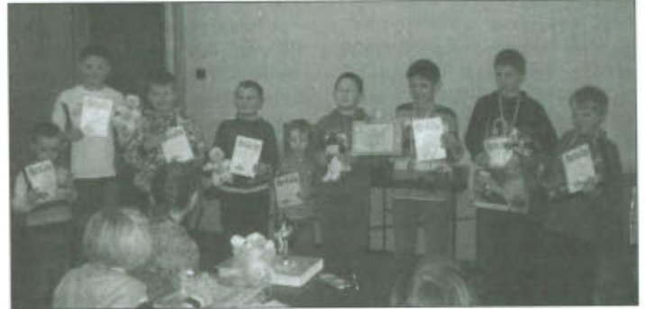
Najlepsi otrzymali medale a wszyscy uczestnicy dyplomy i maskotki