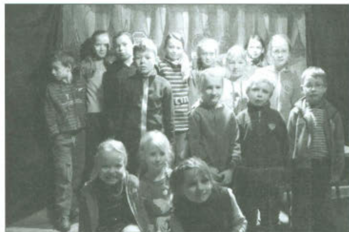
Na scenie „Wilka i zająca”