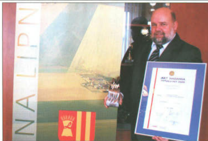
Gminny program utylizacji eternitu otrzymał tytuł „Hit Wielkopolski 2009”. Więcej na stronie 2