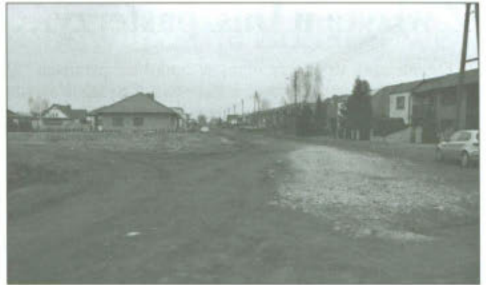
Już niedługo ruszy budowa kanalizacji na nowym osiedlu w Lipnie

również wspomnieć, że wykonano prace przy wycince odrostów drzew, tak aby ułatwić mieszkańcom wyjazd