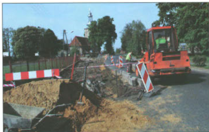
Prace w Wilkowicach