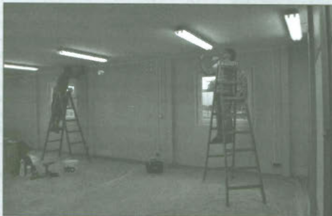
Łącznie na Sali w Goniembicach i Klonówcu musi być dokonane 17 poprawek

na nowo ściany i sufit, a następnie całą salę pomalować. A może gdyby konstrukcja ścian nie była zmieniana, to dzisiaj po niecałym roku nie trzeba byłoby dokonywać napraw. Łącznie na Sali w Goniembicach i Klonówcu musi być dokonane 17 poprawek. Praktycznie w jed-