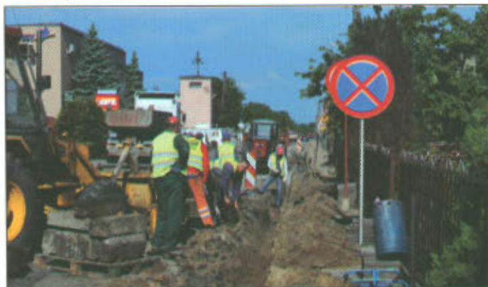
Remont drogi w Lipnie