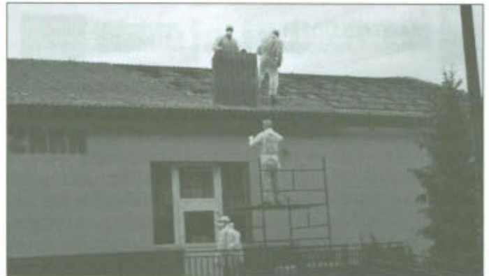
Sala w Wilkowicach