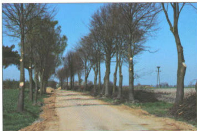
Nowa droga w Mórkwie Nowym