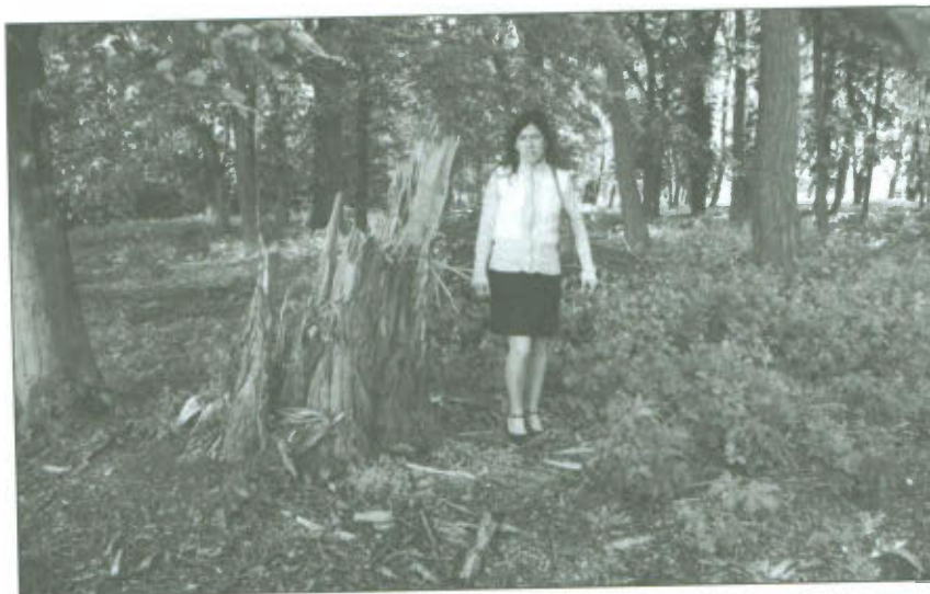
Na gminę nałożono karę za wycięcie 58 drzew, a jej wysokość zależy od gatunku i obwodu pnia drzewa