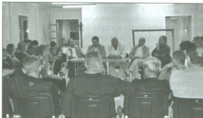
Podczas spotkania w Goniembicach nie brakowało emocji