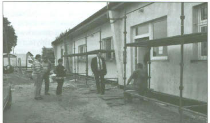
Sala w Smyczynie