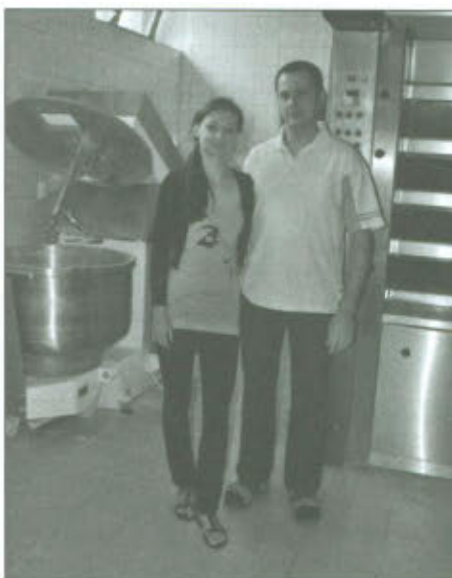
Piekarnia w Wilkowicach

prace robotnikom. W markecie zatrudnienie znajdzie kilkanaście osób, a klienci na prawie 300 m 2 znajdą ponad 4 tysiące produktów.