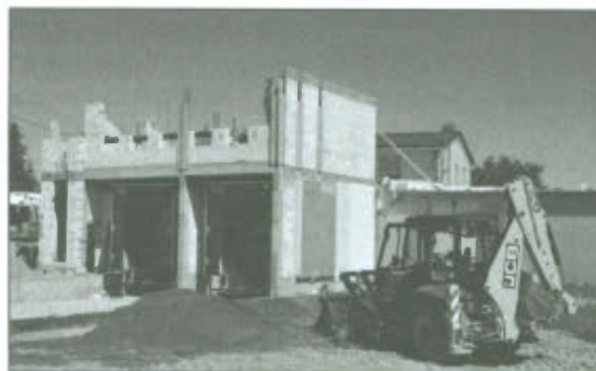
Inwestycje w firmie „Chłodnie Misiorny” w Mórkowie