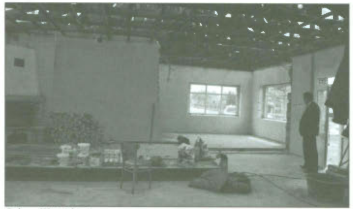
Sala w Wyciążkowie