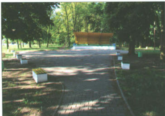
Odnowiony park w Lipnie