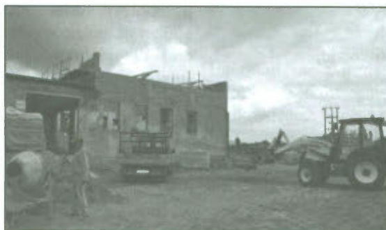
Budowa obiektu firmy „Agrohandel”