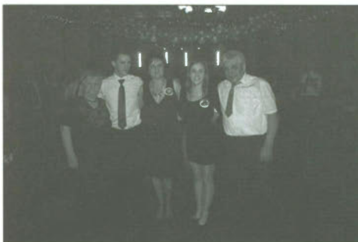
„Najstarsza i najmłodszą Parę” na balu.