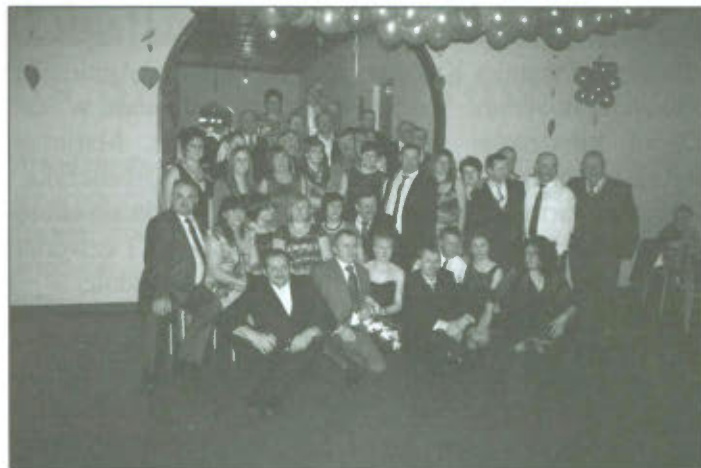
Członkowie Klubu „Traktor i Maszyna”

Wzruszenia i zadowolenia nie ukrywały wyróżnione pary. Miła i serdeczna atmosfera balu sprzyjała dobrej zabawie do białego rana.