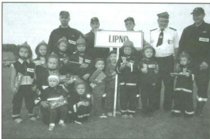
Zdjęcie grupowe z najmłodszymi strażakami OSP Lipno.