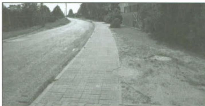
Chodnik w Wilkowicach.