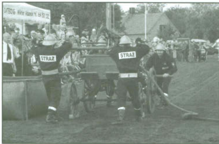
Strażacy OSP Lipno przy sikawce konnej.

Drużyny rywalizowały ze sobą pod względem wyglądu sikawek, ubioru strażaków oraz w konkurencjach sprawnościowych pokonując tor przeszkód: slalom z drabiną,