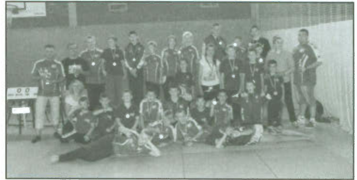
Zawodnicy sekcji UKS "Junior" Lipno na Turnieju w Furstenwalde.

Podsumowując, słowa podziękowania należą się dla wszystkich uczestników naszego klubu za godne reprezentowanie barw klubowych. Można jednoznacznie stwierdzić,