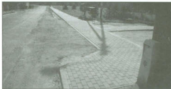
Chodnik w Goniembicach.