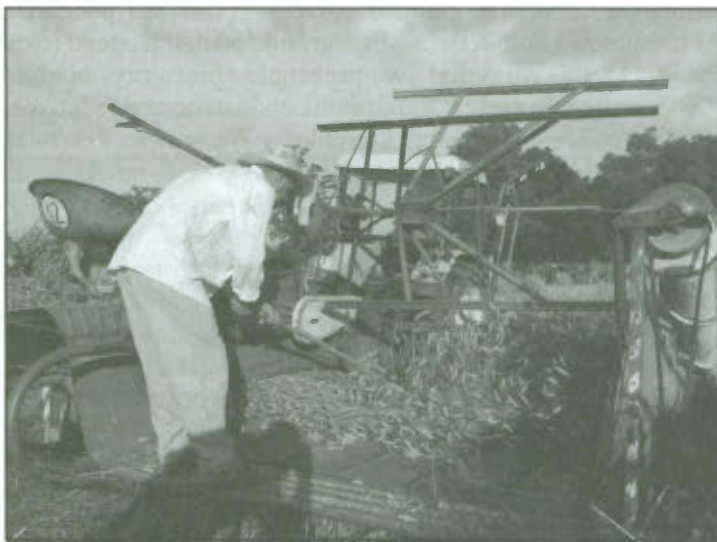
Snopowiązałka "Warta 2".