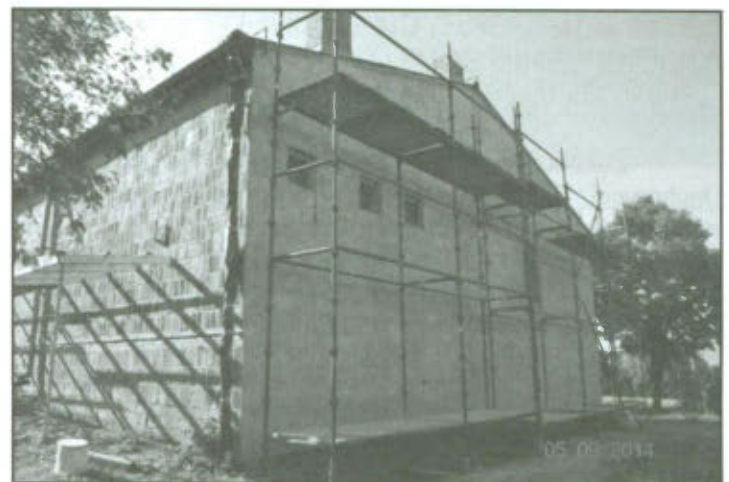
Świetlica wiejska w Radomicku.