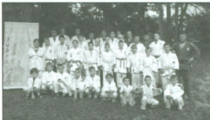
Zgrupowanie sportowe UKS "Junior" Lipno.