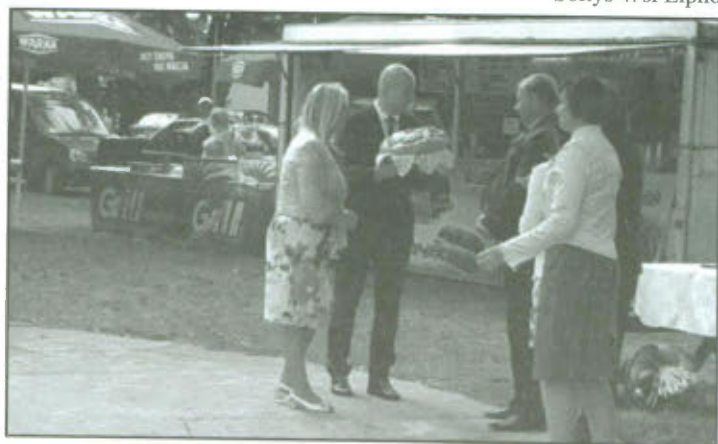
Przekazanie chleba dożynkowego w Lipnie.