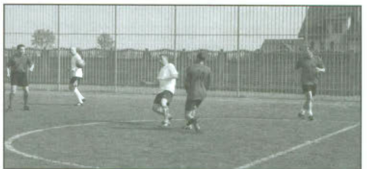
Mecz towarzyski Samorządowcy vs Nauczyciele.