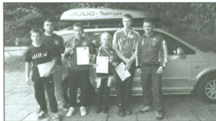
UKS "Junior" w Lipnie na XII Międzynarodowym Turnieju Judo Młodzików w Słupsku.