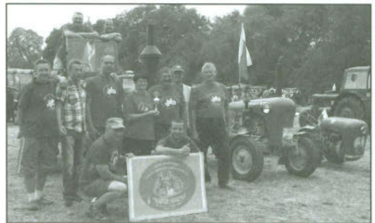
Członkowie Klubu "Traktor i Maszyna" na zlocie w Zechin (Niemcy).

W jedno z sierpniowych popołudni br. Na polach w Wilkowicach odbył się zbiór zboża starymi maszynami. Chrząst bojowy przeszła snopowiązałka „Warta 2” zakupiona przez klub „Traktor i Maszyna”.