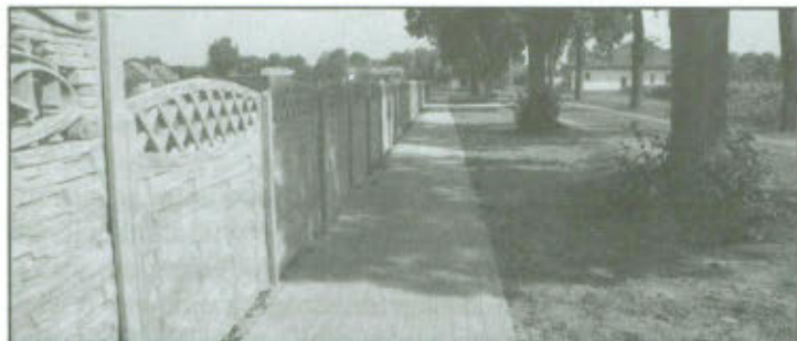
Chodnik w Klonówcju.