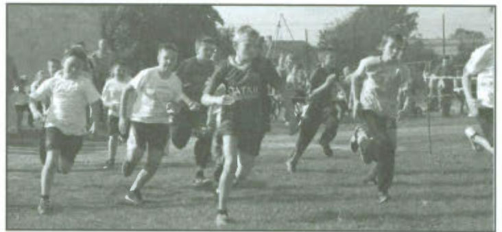
Bieg chłopców na 1200 m.

20 września br. na boisku szkolnym w Lipnie odbyły się Indywidualne Biegi Przełajowe Pożegnanie Lata. Celem imprezy było upowszechnienie biegania jako najprostszej formy ruchu, wspieranie rekreacji sportowej oraz promocja Gminy Lipno. W zawodach wzięło udział łącznie 106 osób. Po zakończonym biegu każdy uczestnik otrzymał kamizelkę odblaskową.