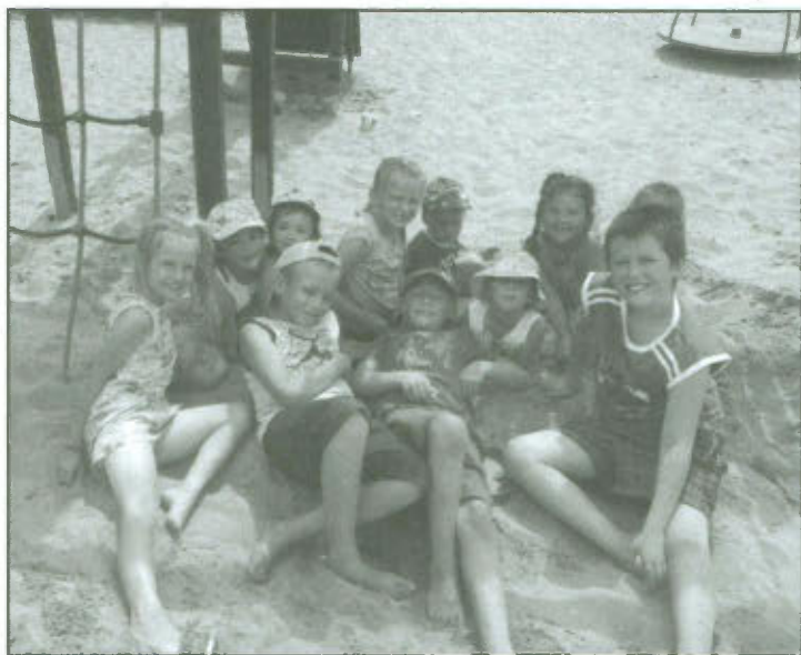
Uczestnicy wakacji w Goniembicach.