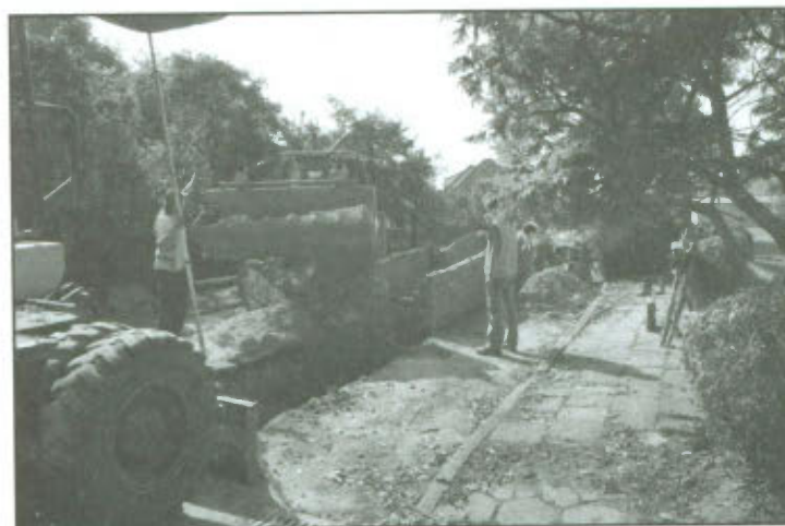
Budowa kanalizacji sanitarnej w Mórkowie etap III.