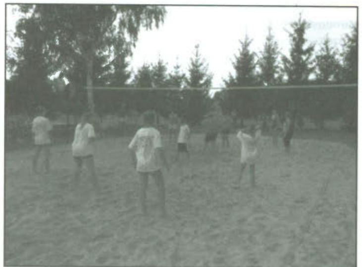
Rozgrywki podczas Turnieju Siatkówki Plażowej Kobiet.