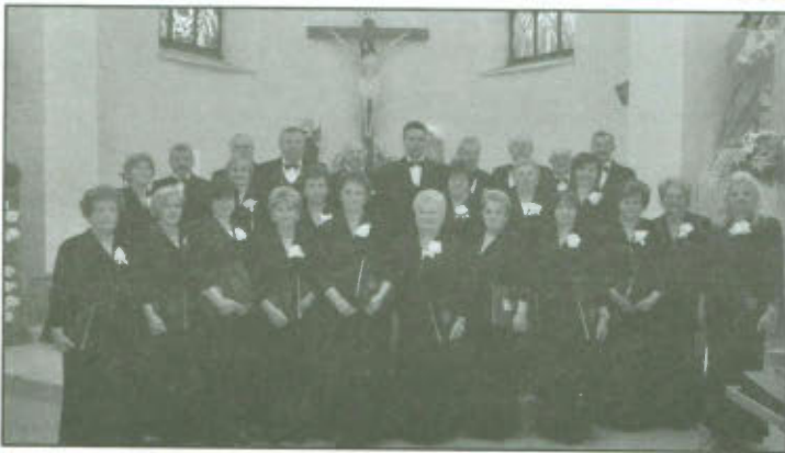
Chór "Rapsodia" podczas koncertu w Kościele w Mostach (Czechy).