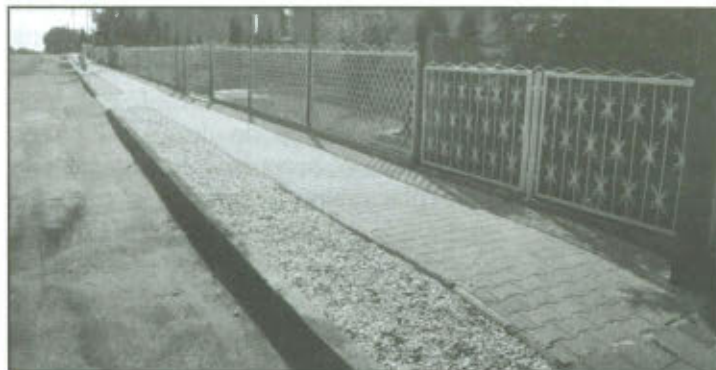
Chodnik w Górce Duchownej.