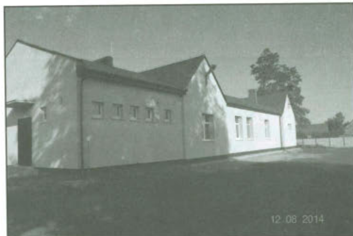
Świetlica wiejska w Górcie Duchownej - widok z tyłu.