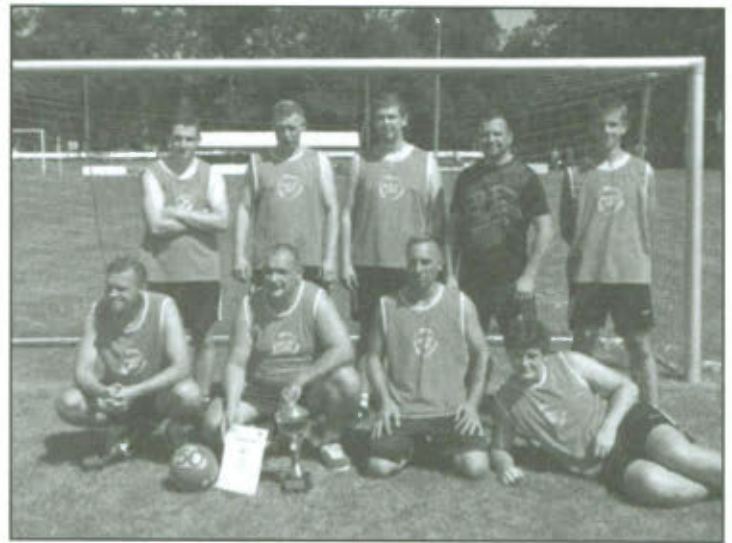
Zwycięska drużyna Turnieju Piłki Nożnej o Puchar Wójta Gminy Lipno.