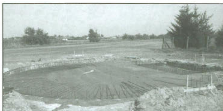
Zbiornik wody pitnej w trakcie budowy.