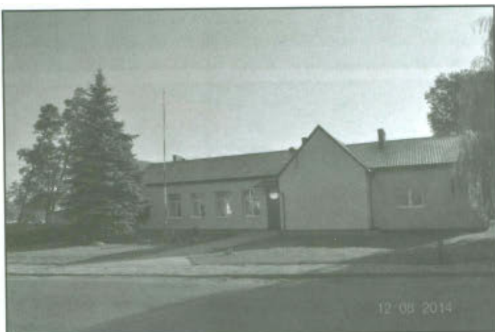
Świetlica wiejska w Górcie Duchownej - widok z przodu.