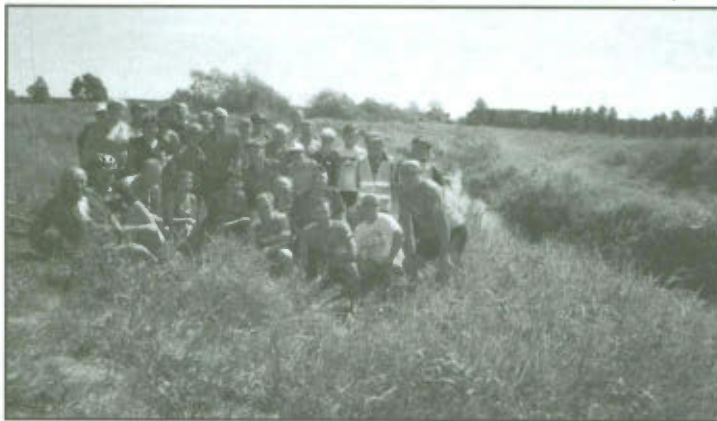
Uczestnicy wyprawy doliną Rzeki Samicy do jej ujścia.