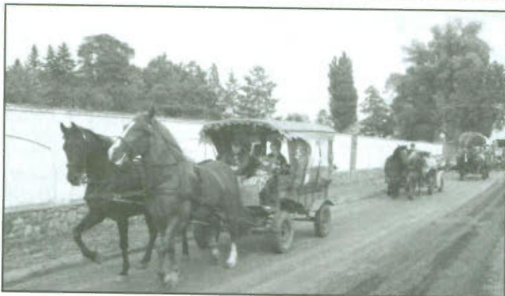
Korowód dożynkowy w Mórkowie.