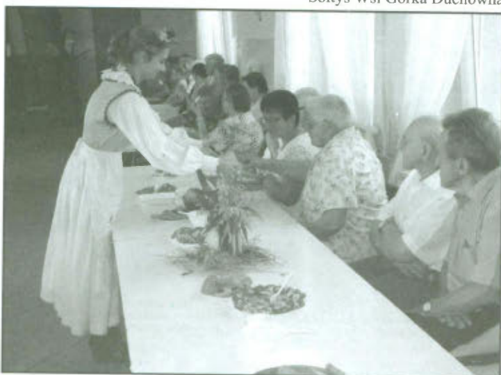
Poczęstunek chlebem dożynkowym w Górcie Duchownej.