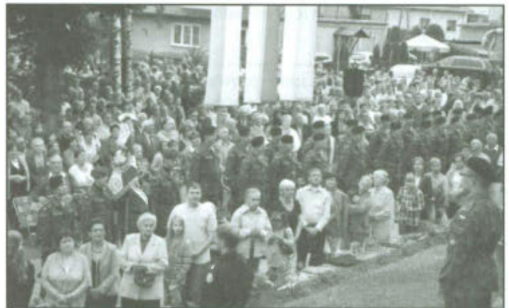
Msza Św. z okazji XXV Pielgrzymki Oficerów i Żołnierzy Garnizonu Leszczyńskiego.