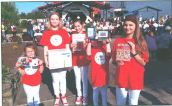
Piknik z książką w Wilkowicach.