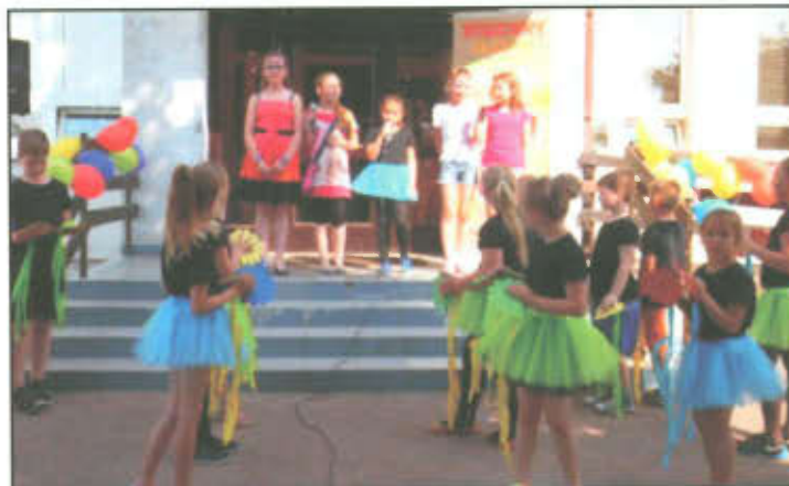
Występy artystyczne na Festynie Rodzinnym w Lipnie.

To było gorące popołudnie. I nie tylko dlatego, że żar lał się z nieba. W sobotę, 4 czerwca na szkolnym boisku nauczyciele i rodzice zorganizowali festyn rodzinny. Przygotowania były intensywne. Do pracy gotowali się organizatorzy, a do zabawy dzieci i ich rodzice. A walczyć było o co! W konkurencjach rodzinnych można było wygrać tablety, ponton i dmuchany fotel. Trofea warte były wylanego potu. Na szczęście straż pożarna gasiła... lub raczej chłodziła zagorzałe boje. Już po wyznaczonych konkurencjach strażacy sprawili frajdę dzieciom i pozwolili się kąpać w strugach wody. Było super! Patrząc na dzieci żałowałam, że mnie już nie wypada biegać na bosaka po trawie. A ochotę na to miałam nie tylko ja.