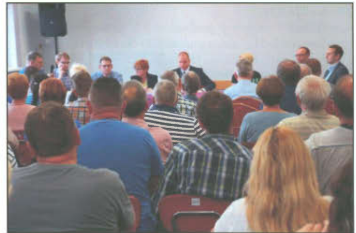
Uczestnicy spotkania w sprawie budowy drogi ekspresowej S5.