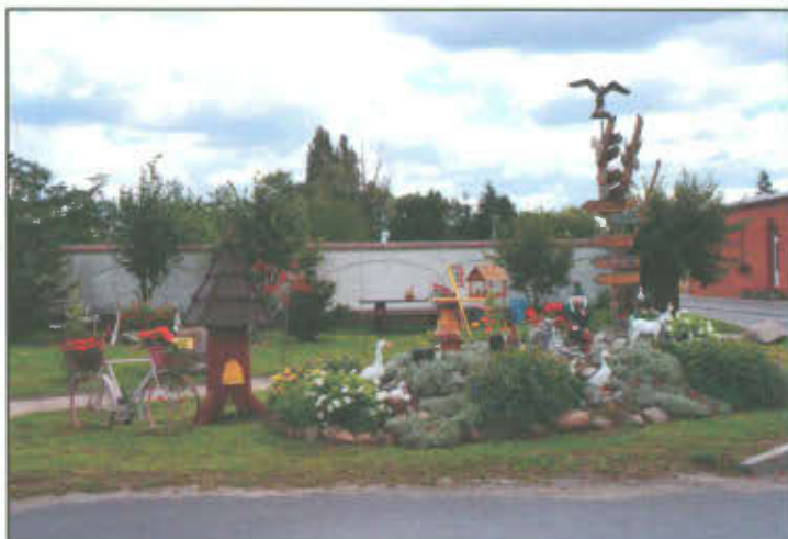
Teren przy głównym skrzyżowaniu w Mórkowie.