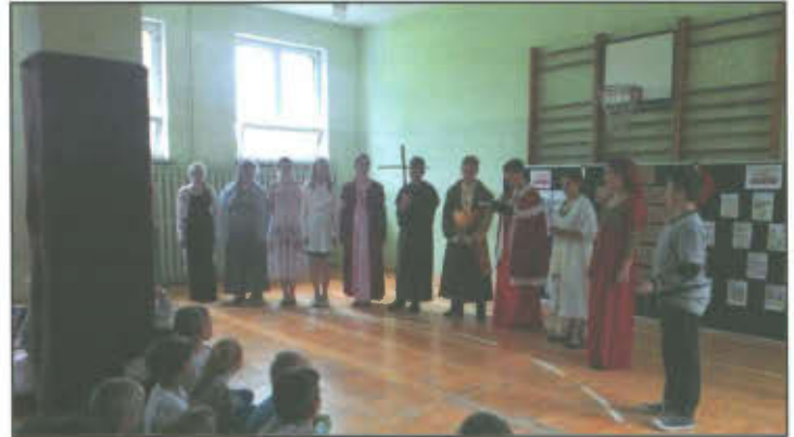
Inscenizacja przedstawiająca początki chrześcijaństwa w Polsce.

Nasza szkoła włączyła się w centralne obchody jubileuszu 1050-lecia chrztu Polski, które miały miejsce w czerwcu w Poznaniu. Z tej okazji przygotowaliśmy inscenizację prezentującą początki chrześcijaństwa w Polsce, podczas której przypomnieliśmy młodemu pokoleniu wydarzenia sprzed tysiąca lat.