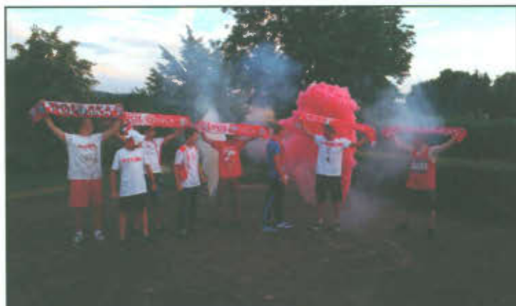
Jednostka OSP Wilkowice podczas ćwiczenia bojowego.