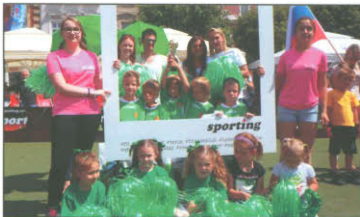
Reprezentacja Przedszkola w Lipnie na Mini Euro 2016.