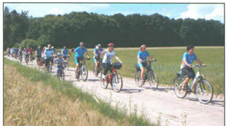
Cykliści na trasie Rajdu Rowerowego.