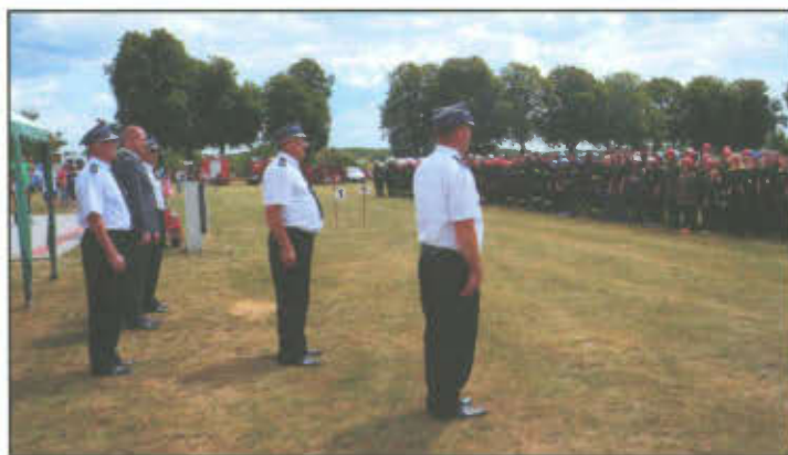
Oficjalne otwarcie Zawodów Sportowo-Pożarniczych.

Sportowa rywalizacja, wspaniała atmosfera oraz strażacki doping to wszystko towarzyszyło Gminnym Zawodom Sportowo-Pożarniczym, które odbyły się w dniu 12 czerwca br. na boisku sportowym w Klonówcu.