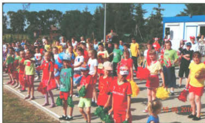
Uczniowie Szkoły Podstawowej w Goniembicach wykonują układ taneczny.