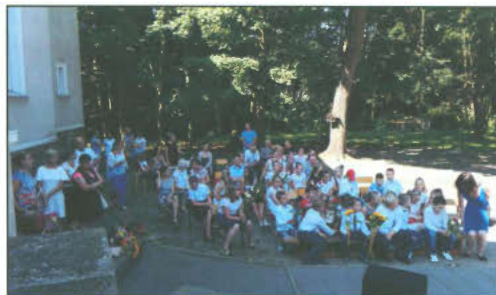
Uroczyste zakończenie roku szkolnego w Górcie Duchownej.