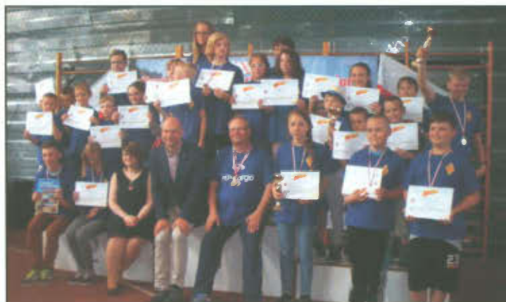
Zdjęcie grupowe UKS "Roszada" Lipno.