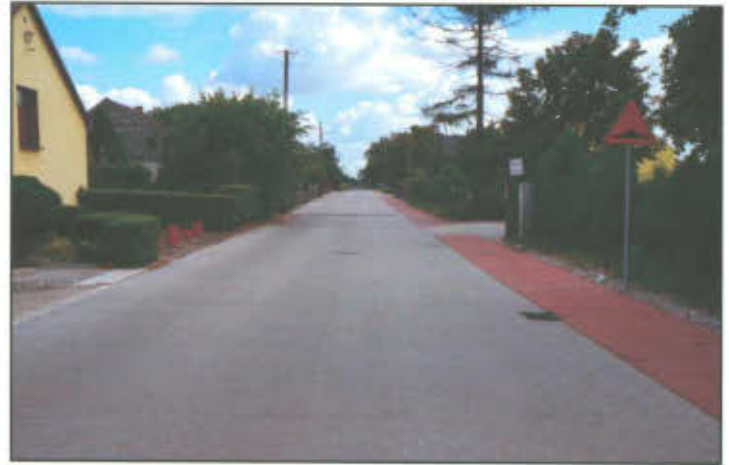
Ul. Boczna w Wilkowicach (widok od ul. Lipowej).