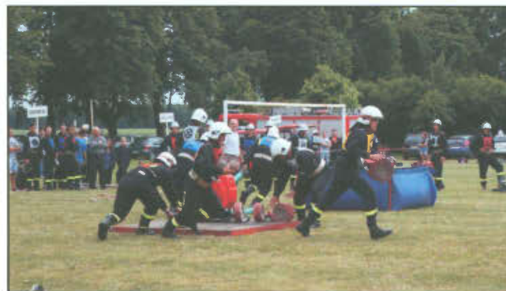
Jednostka OSP Wilkowice podczas ćwiczenia bojowego.