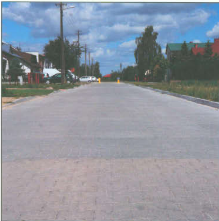
Ul. Słoneczna w Lipnie.