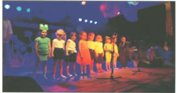
Na scenie dziewczynki z kółka literacko - teatralnego.