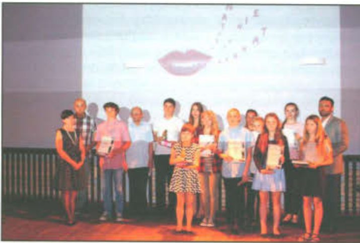
II Gminne Wspólne Czytanie z Biblioteką.