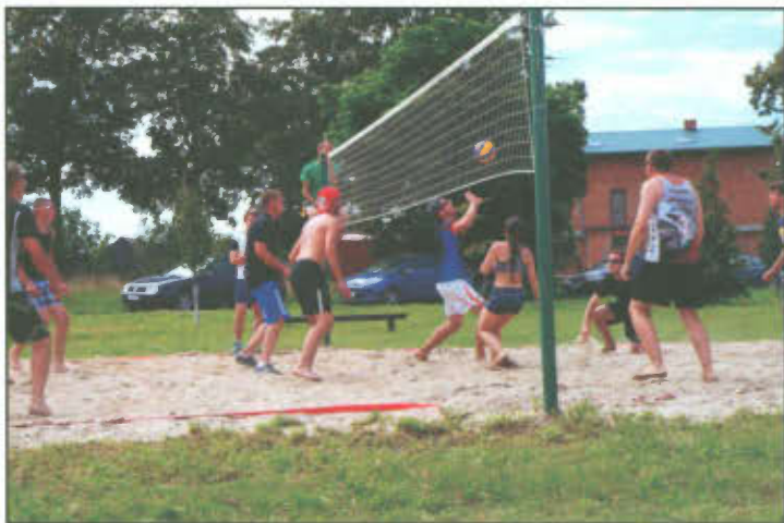
Mecz finałowy zespołów - Młodzi Wilcy i All Stars podczas Plażowego Turnieju Piłki Siatkowej im. Grzegorza Olejnika.

W niedzielę 10 lipca br. w Wyciążkowie odbył się Plażowy Turniej Piłki Siatkowej im. Grzegorza Olejnika. W Turnieju wzięło udział dziewięć zespołów, które zagrały w dwóch grupach. Grupa A: Młodzi Wilcy, Dream Team, OSP Mierzejewo, All Stars i OSP Wyciążkowo. Grupa B: Unia Wyciążkowo, OSP Osieczna, Summer i OSP Goniembice. Po zaciętej rywalizacji I miejsce zajęła drużyna Młodzi Wilcy, II miejsce zespół All Stars, III miejsce drużyna Unia Wyciążkowo.