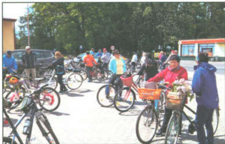
Cykliści przed startem w Wilkowicach.