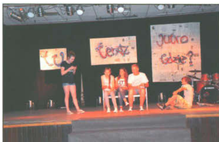
Spektakl "Bal się właśnie zaczyna".

Fundacja Europejski Fundusz Rozwoju Wsi Polskiej to organizacja pozarządowa, działająca na rzecz rozwoju polskiej wsi. Od ponad 25 lat pomaga zmieniać jej wizerunek oraz aktywnie wspiera rozwój społeczno-gospodarczy lokalnych społeczności na terenach wiejskich. Działania EFRWP skupiają się przede wszystkim na wspieraniu inwestycji z zakresu infrastruktury technicznej i rozwoju lokalnych przedsiębiorstw oraz działaniach społecznych i edukacyjnych skierowanych do osób zamieszkujących obszary wiejskie. Do jednego z najważniejszych zadań Fundacji należy wspieranie oświaty na terenach wiejskich. Od samego początku istnienia EFRWP aktywnie działa na rzecz edukacji oraz wyrównywania szans dzieci i młodzieży, zamieszkujących wsie i małe miasta.