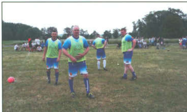
Uczestnicy Turnieju Piłki Nożnej o Puchar Sołtysów.