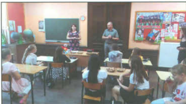
Uczestnicy Gminnego Konkursu Ortograficznego o Pióro Wójta Gminy Lipno.