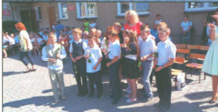
Zakończenie roku szkolnego w Szkole Podstawowej w Goniembicach.