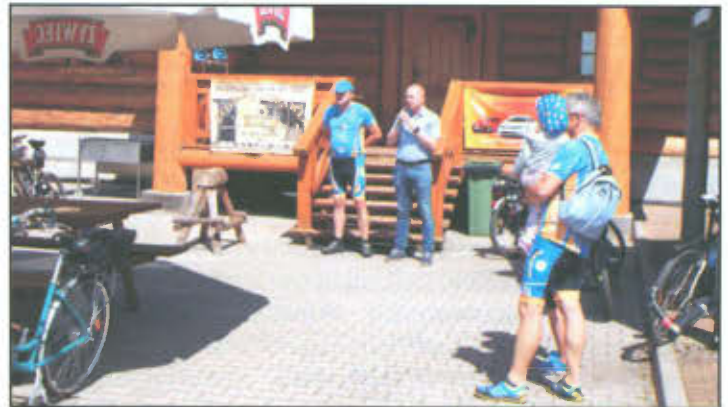
Oficjalne otwarcie III Rajdu "Poznaj Gminę Lipno".