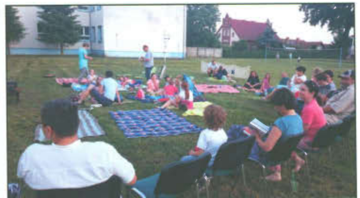
Piknik z książką w Wilkowicach.