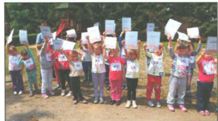
Dzieci uczestniczące w mini maratonie biegowym.

Dnia 19 maja br. dzieci z dwóch starszych grup uczestniczyły w mini maratonie biegowym pod hasłem "Sprintem do maratonu". Tego dnia, wszystkie dzieci przysły do przedszkola w sportowych strojach. Radości nie było końca. Po raz pierwszy w naszym przedszkolu odbył się mini maraton połączony z ogólnopolską akcją biegową, organizowaną przez miesięcznik Bliżej Przedszkola. W tym dniu zjedliśmy śniadanko, a następnie wybraliśmy się do ogrodu przedszkolnego, gdzie wyznaczony był dystans 100 m, który każde dziecko musiało chociaż raz przebiec. Na