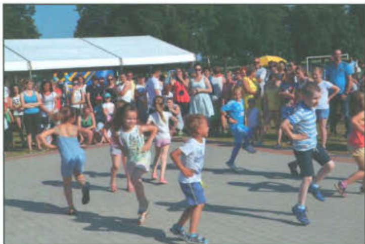
Gminny Dzień Dziecka w Klonówcu.