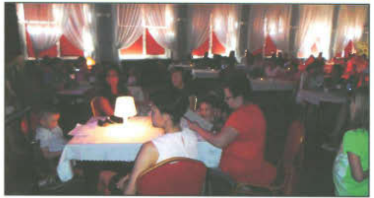
Wieczorek literacki Przedszkola w Lipnie.