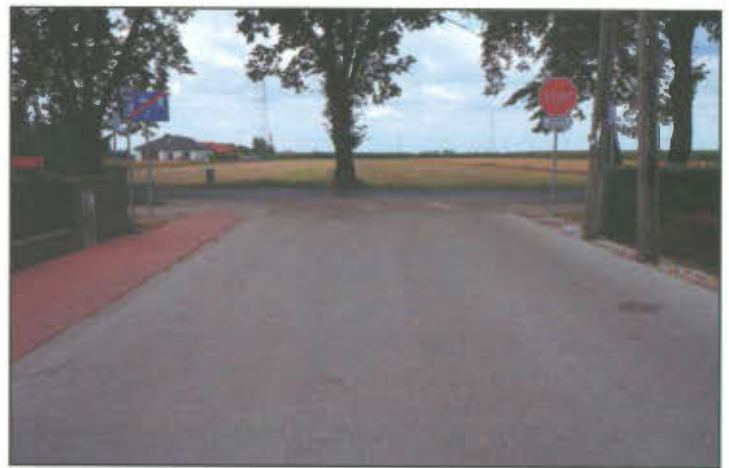
Ul. Boczna w Wilkowicach (widok w stronę ul. Lipowej).

Zakończyła się inwestycja związana z przebudową pierwszego odcinka ul. Bocznej w Wilkowicach, polegająca na utwardzeniu nawierzchni w w. ulicy kostką brukową oraz wybudowaniu kanalizacji deszczowej w celu zapewnienia odwodnienia nowo powstałej drogi.