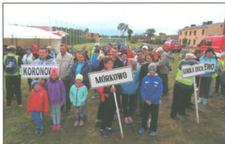
Uczestnicy rowerówki Sołtysów Gminy Lipno.