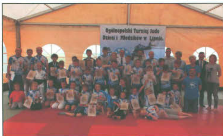
Zdjęcie grupowe UKS „Junior” Lipno.

Turniej Judo w Lipnie zgromadził łącznie 320 zawodników i zawodniczek z 27 klubów, w tym jeden klub z Niemiec. Nasz klub reprezentowała również rekordowa liczba zawodników - dokładnie 53 osoby. Zawody otworzyła Grupa Feniks Fogo Skydive Team niepowtarzalnym pokazem skoków spadochronowych z flagami Sekcji Judo UKS „Junior” w Lipnie i Rada Elka. Turniej okazał się sukcesem sportowym i organizacyjnym dzięki współorganizatorom: Urzędowi Gminy w Lipnie, Starostwu Powiatowemu w Lesznie, Gminnemu Ośrodkowi Kultury w Lipnie, Komendzie Miejskiej Policji w Lesznie, Szkole Podstawowej i Gimnazjum w Lipnie oraz Zarządowi UKS „Junior” w Lipnie, jak również ponad 30 sponsorom.