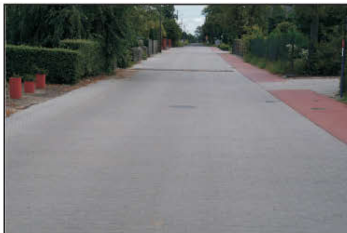
Ul. Boczna w Wilkowicach.