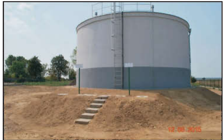
Zbiornik wody pitnej w Maryszewicach.