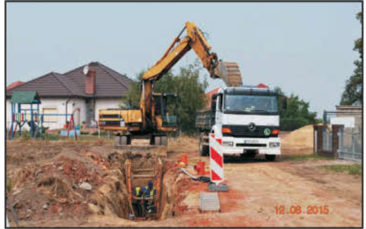
Budowa kanalizacji sanitarnej w Wilkowicach.