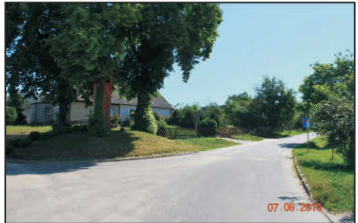
Zmodernizowana droga w Targowisku.