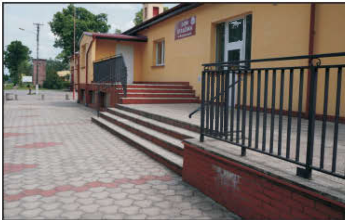
Dom Strażaka w Wilkowicach.