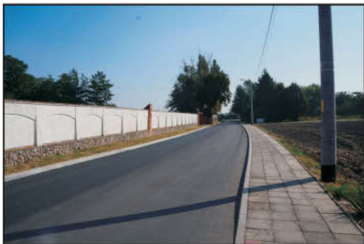
Droga gminna w Mórkowie.