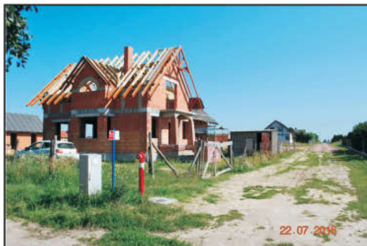
Sieć wodociągowa na ul. Rolnej w Wilkowicach.