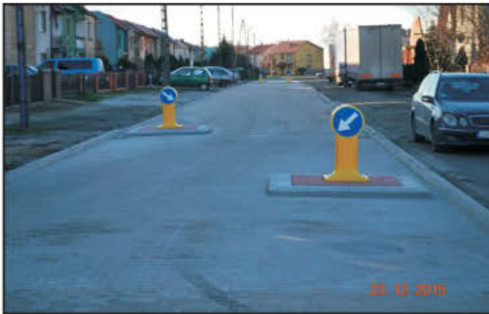
Ul. Nowa w Lipnie.