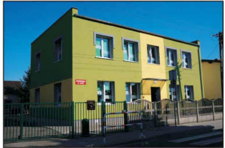
Przedszkole w Lipnie.