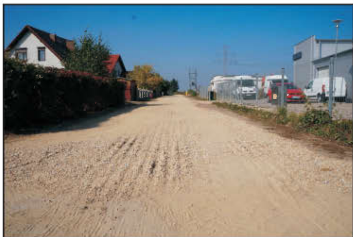
Ul. Usługowa w Wilkowicach.