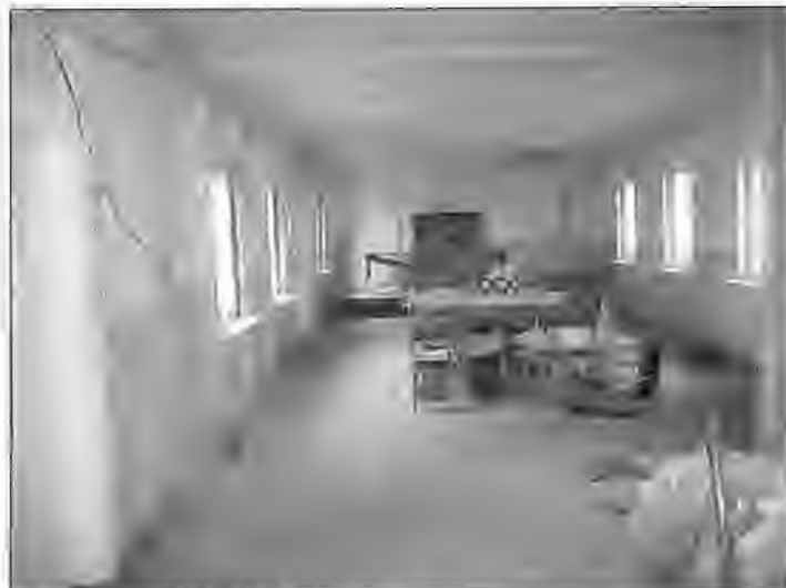
Sala w Ratowicach przed remontem