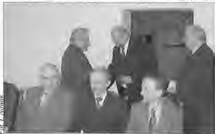
Wręczenie podziękowań byłym sołtysom i radnym