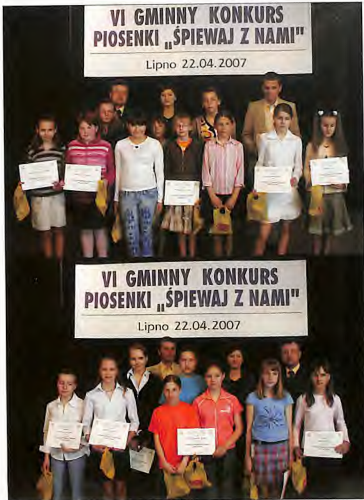
VI Gminny Konkurs Piosenki „Śpiewaj z nami”