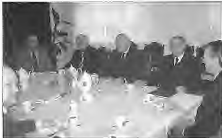
Spotkanie władarzy powiatu leszczyńskiego