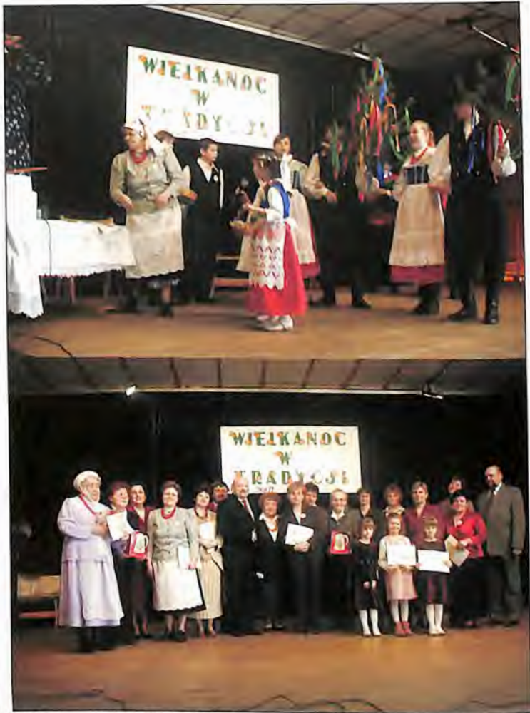
VIII Przegląd Widowisk Wielkanocnych i Plastyki Obrzędowej „Wielkanoc w tradycji”