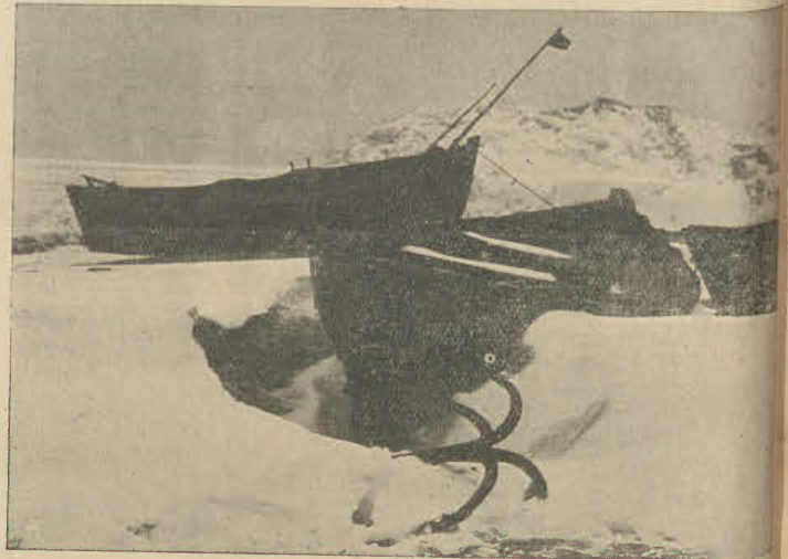
Gdy w zaciszniejszych zatokach lód, wyrzucony na brzeg, tworzy prawdziwe góry.