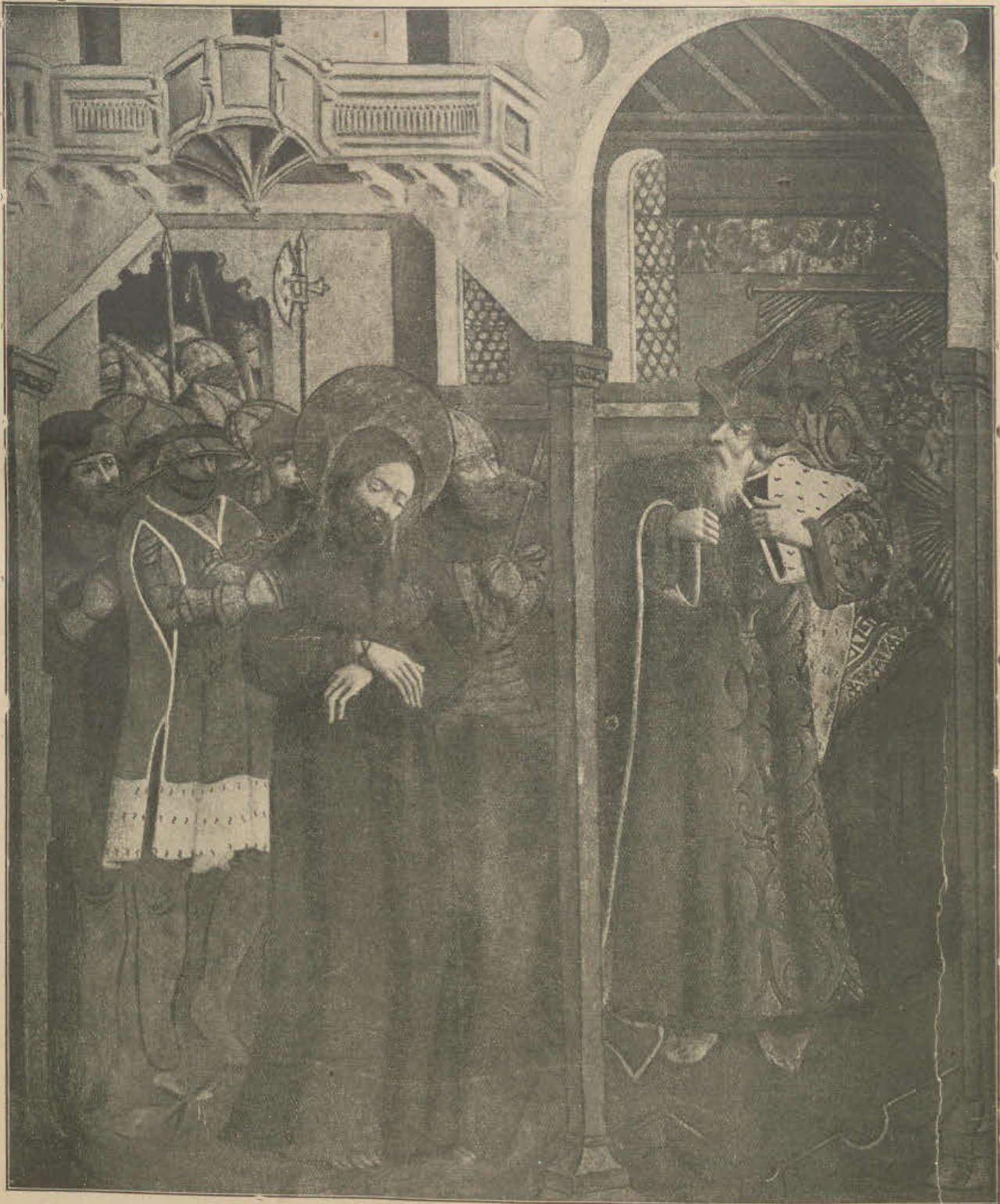
Chrystus przed Kaifaszem. Obraz z klasztoru OO. Augustynów w Krakowie.