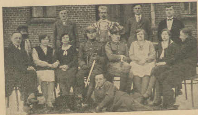
Przedstawienie amatorskie „Żyd w becze” Towarzystwa Młodzieży Wiejskiej w Słupi Kapitulnej, pow. Rawicz.