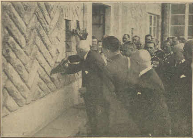
Wmurowanie aktu erekcyjnego w ścianie zamczeka w Wiśle, przy udziale P. Prezydenta Rzplitej.