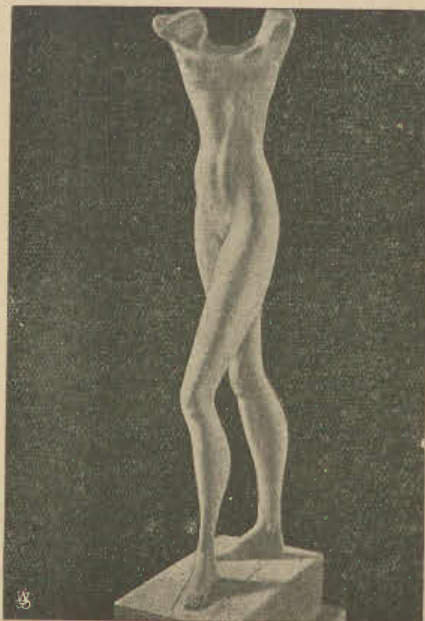
Sztuka bolszewicka. Pierwszy posąg (bez głowy) ma przedstawiać „dążenie naprzód”, drugi — niewiadomo co.