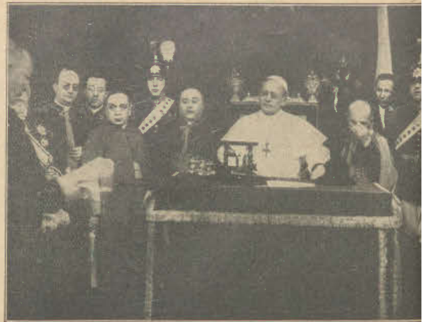
W obecności papieża odbyło się uroczyste otwarcie stacji radiowej w Watykanie. W dniu tym Pius XI przemawiał bezpośrednio do słuchaczy całego świata.