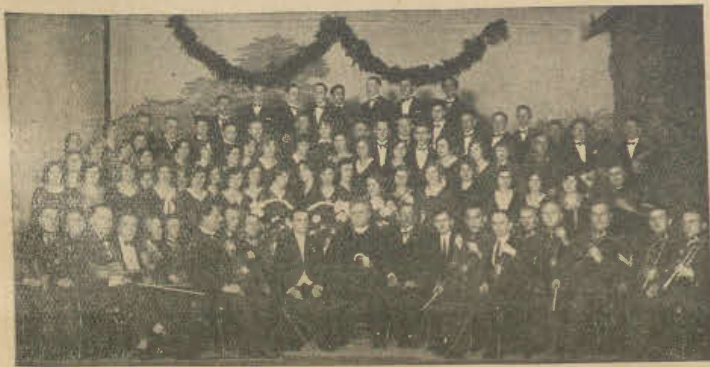
Chór kościelny pod wezw. św. Kazimierza w Lesznie, który wykona w dniu 5 marca r. b., w sali Hotelu Polskiego, wielką mszę Haydna B-dur, transmitowaną do Radja Poznańskiego.