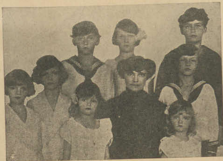
Ex-cesarzowa austriacka Zyta, w otoczeniu swych dzieci.