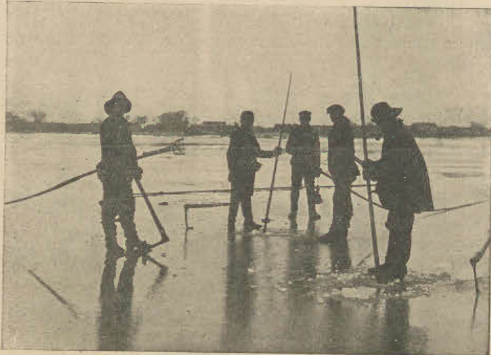
Jednak węgorze nie są bezpieczne nawet pod lodem, bo przez przerębel dosięgnie je długa ość.