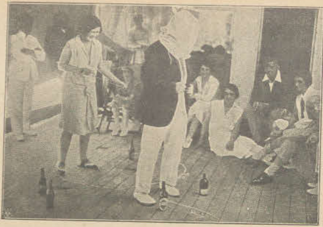
Nudne podróże dają okazję wznowienia starej mody: gra w „ciuciubabkę” na pokładzie oceanicznego parowca. Gra jest obostrzona: nie wolno przewrócić butelki.