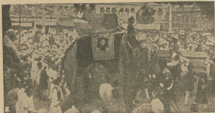
Pochód małego maharadży Gwalioru