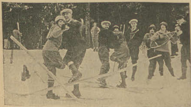
Walc na nartach nie jest rzeczą łatwą.