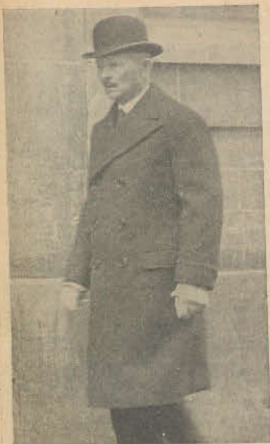
Na miejsce marszałka Pétain, który opuścił naczelny Inspektorat Armji francuskiej, został mianowany generał dyw. Weygand.