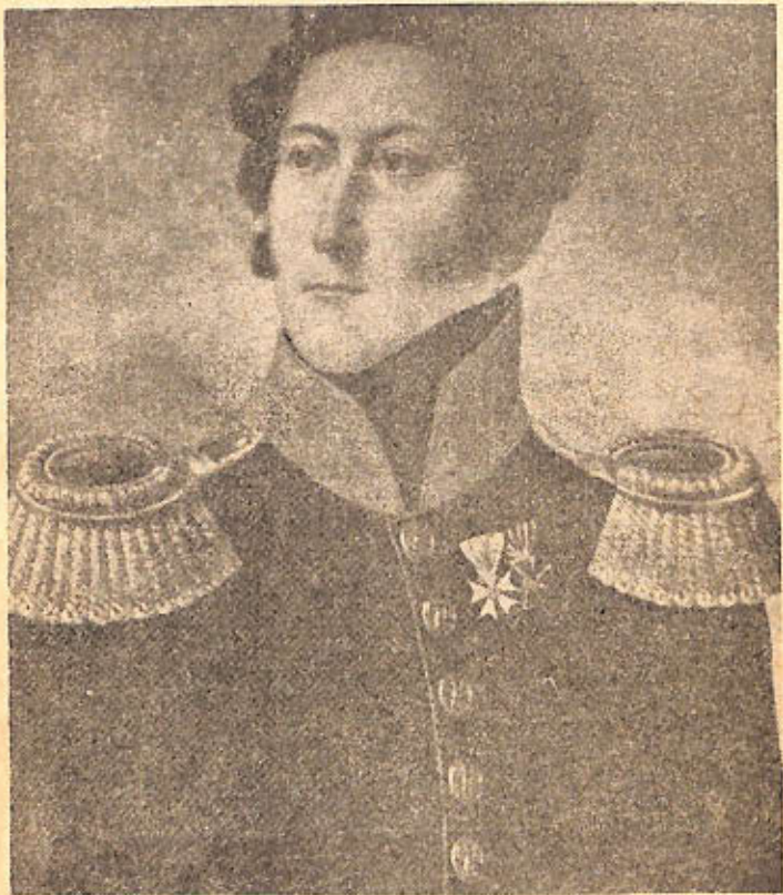
1. Franciszek Morawski (1783-1861) w mundurze generała brygady w latach pobytu w Lublinie przed Powstaniem Listopadowym. Mal. Antoni Brodowski (?)