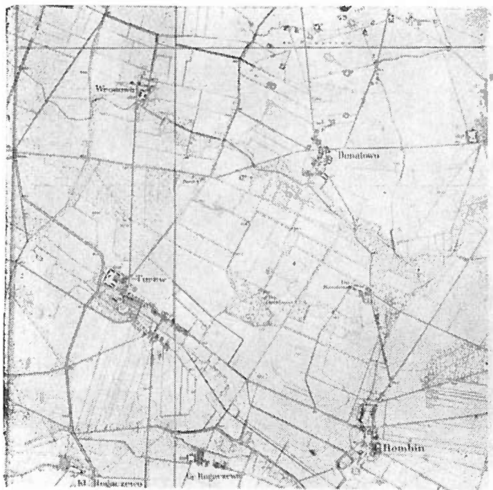
10. Dobra turewskie wg niemieckiej mapy z lat 90-tych ub. wieku.