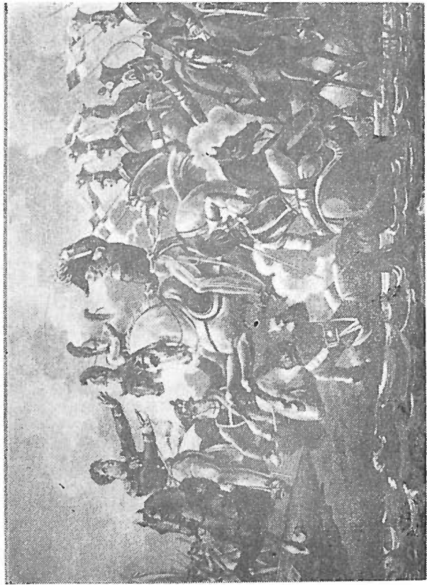
3. Oddziały gen. Chtapowskiego forsują Niemen (Zbiory D. Chtapowskiego)