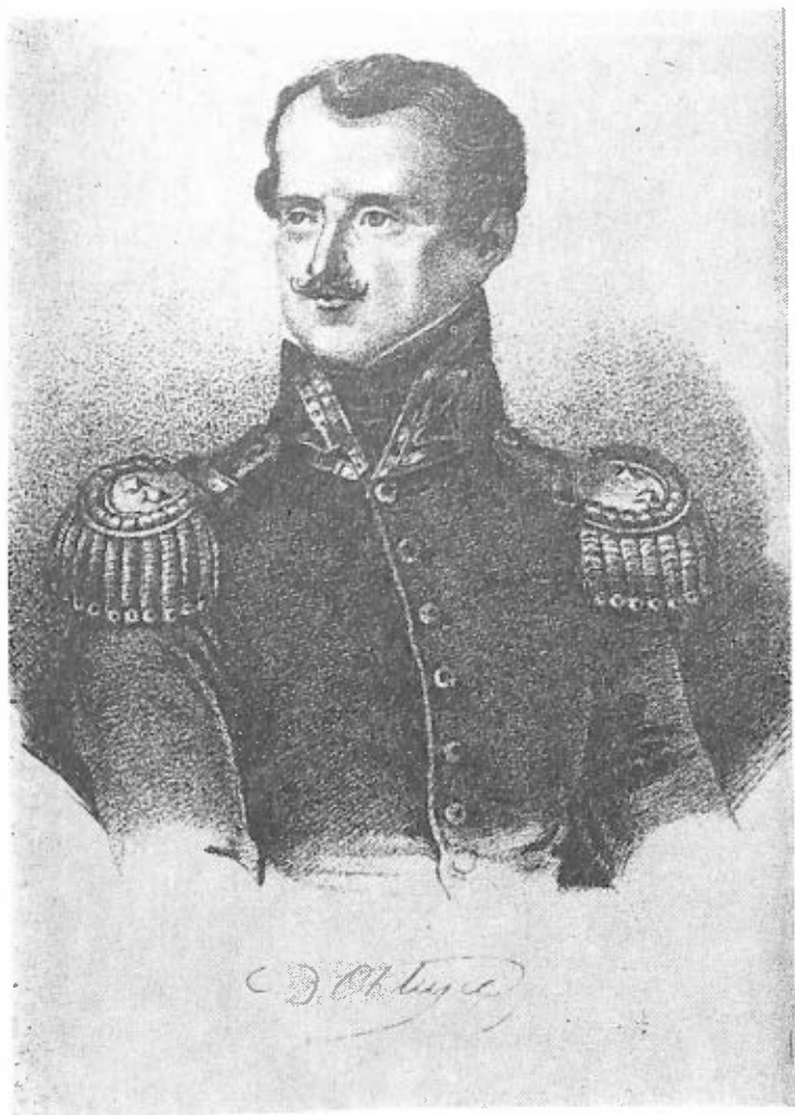
1. Dezydery Chłapowski w okresie napoleońskim