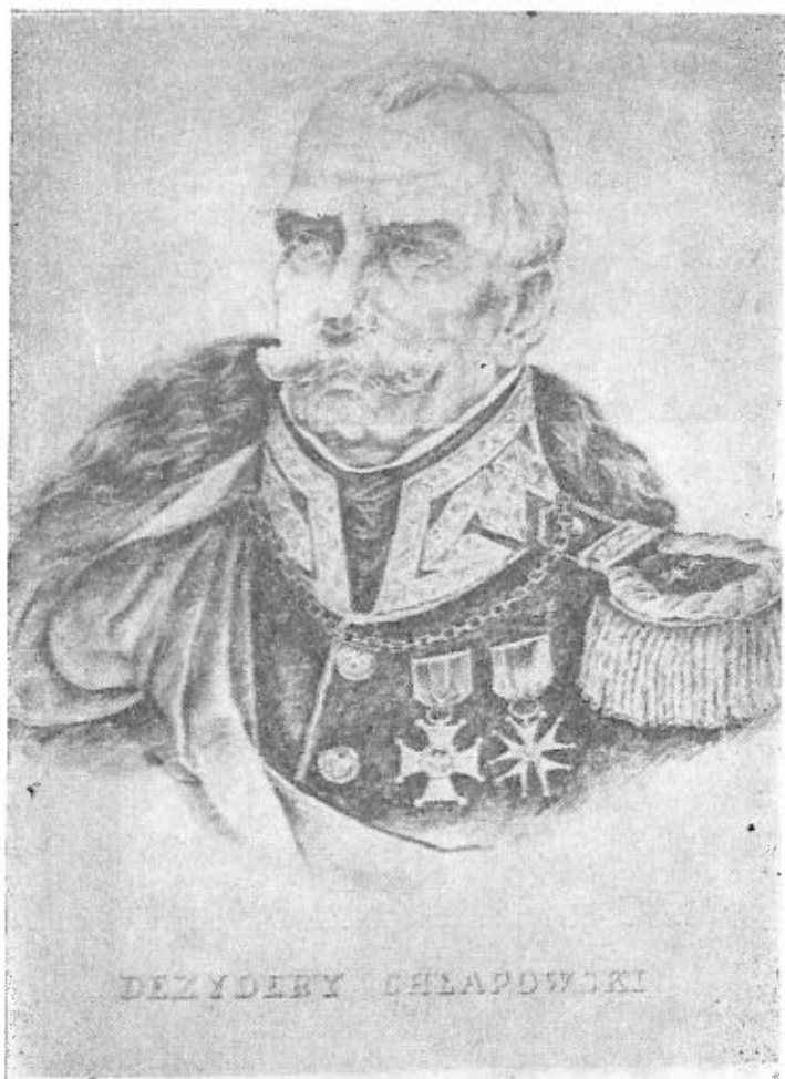
7. Dezydery Chłapowski — portret w mundurze generalskim