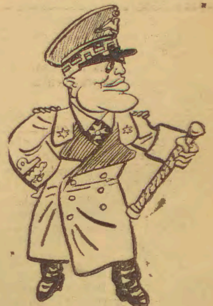
Marsz. Goering, kandydat na wicekanclerza Rzeszy?

Na szczęście nie było ofiar w ludziach, mimo, że znajdowali się niemal na skraju przepaści.