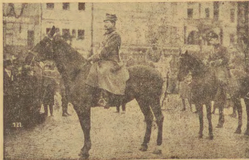
POWITANIE GEN. DOWBÓR MUŚNICKIEGO

Fragment z powitania gen. Dowbór Muśnickiego na rynku w dniu 18 stycznia 1920 r. w dniu po objęciu Leszna przez wojska polskie.