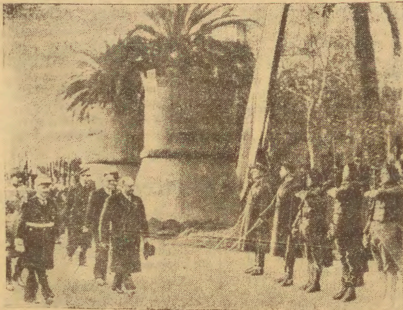
Premier Francji Daladier odbył podróż inspekcyjną na Korsykę i do Tunisu. Na zdjęciu Daladier w towarzystwie ministra Campinchi, po przybyciu do Ajaccio, przed frontem oddziału honorowego Senegalczyków.