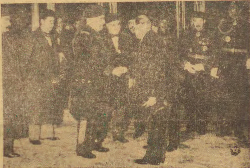
Z POBYTU PREM. DALADIERA W TUNISIE

Po części oficjalnej z przemówieniami odbył się obiad w sali assembly.