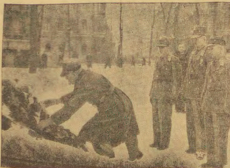
W dniu 8-go bm. odbyła się w Katowicach uroczystość 20-lecia wybuchu Powstania Wielkopolskiego. Prezydium Powstańców Wlkp. złożyło wieniec na płycie „Nie znanego Powstańca”.

stopniowe i ma formę krzyża, pokrytego czarną emalią o złotych brzegach. Krzyż czworokątny płaski, wymiar — 35×35 mm., posiada okrągły napis „Honor i Ojczyzna” na złotym otoku. Na poprzecznych ramionach krzyża, połączonych stylizowanymi liliami skautowymi napis „czuwaj” w kolorze złotym.