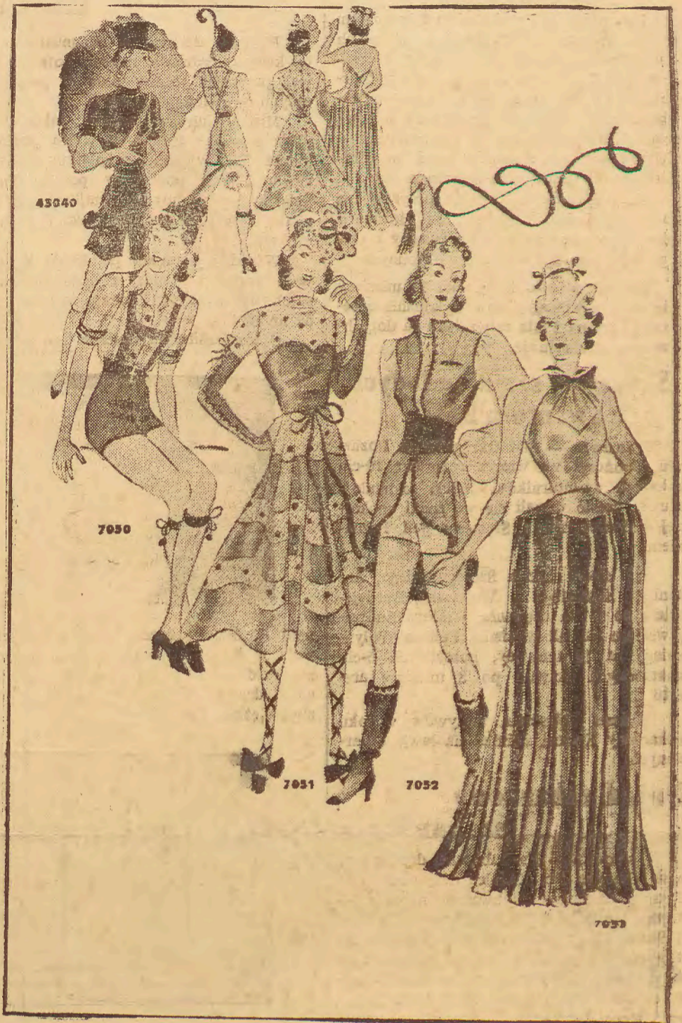
Fig. 7052. Woltyżerka smukła jak sosna! Nosi fraczek bez rękawów z błękitnego aksamitu podbity aksamitem ciemniejszym w tym samym tonie, szeroką szarfę, obcisłe spodnie i bluzka z mocno błyszczącego białego jedwabiu.

Fig. 7053. Bardzo efektowny kostium abażur. Okrągła baskinka do której przyszyte są wielobarwne włazki jest mocno usztywniona i brzegiem obciągnięta drutem. Staniczek z aksamitu, brokatu lub atlasu.