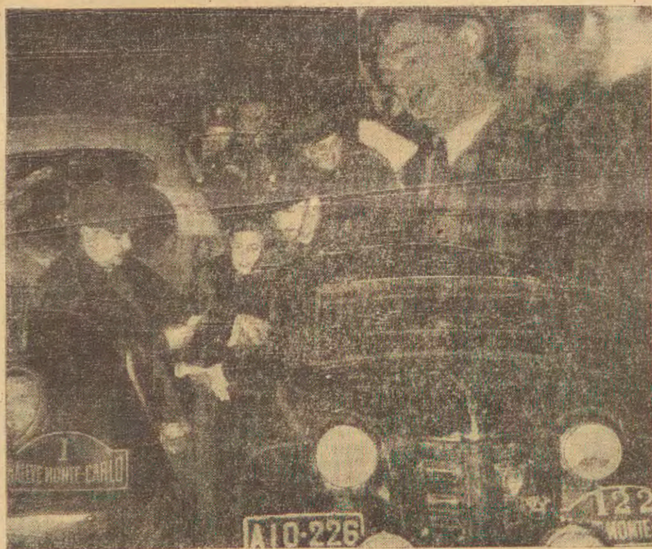
W nocy z dn. 18 na 19-go stycznia przejechały przez Warszawę samochody biorące udział 18-ym rallye do Monte Carlo. Na zdjęciu zawodnicy w Warszawie.

policjanta i groził śmiercią dwóm funkcjonariuszom partyjnym, wreszcie mordercę, który zamordował własną żonę.