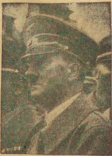
Kancl. Rzeszy Adolf Hitler Następnie zabrał głos kanclerz Hitler.

Ukonstytuowanie się Reichstagu oraz uchwalenie wniosku min. Fricka trwało 11 minut.