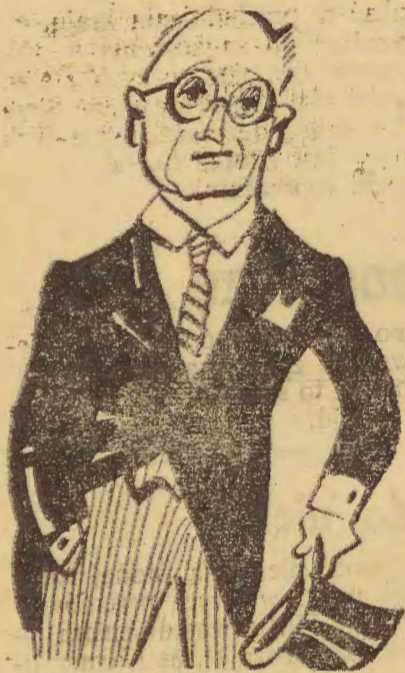
Dr Djelal Bayar, premier turecki