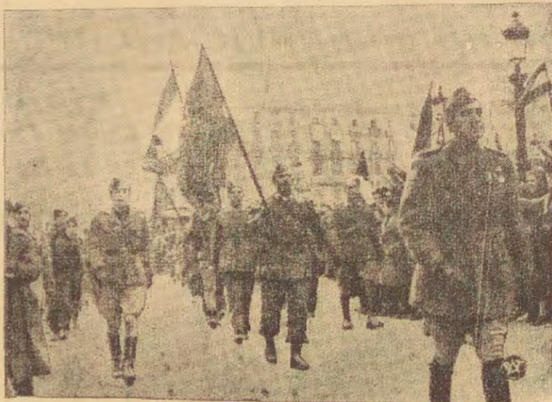
PO ZWYCIĘSTWIE GEN. FRANCO W KATALONII

zem jest m. in. wniesiona w ubiegłym tygodniu interpelacja posła ks. Lubelskiego, uwieńczone zostało ostatecznie pomyślnym wynikiem.