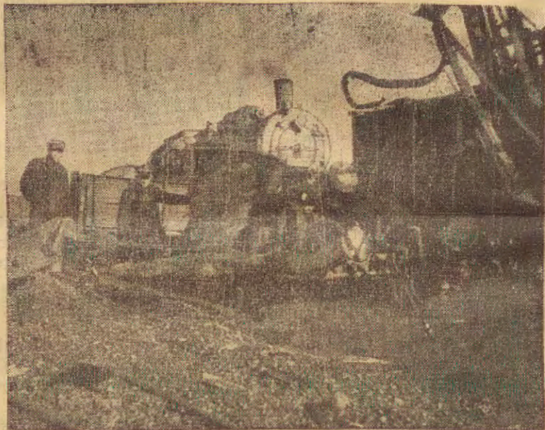
Dnia 9 lutego na linii tranzytowej obok Bogumina nastąpiła katastrofa niemieckich pociągów towar. idących tranzytem przez terytorium polskie.

zapędziła ją na wybrzeża palestyńskie, gdzie też nastąpiła katastrofa.