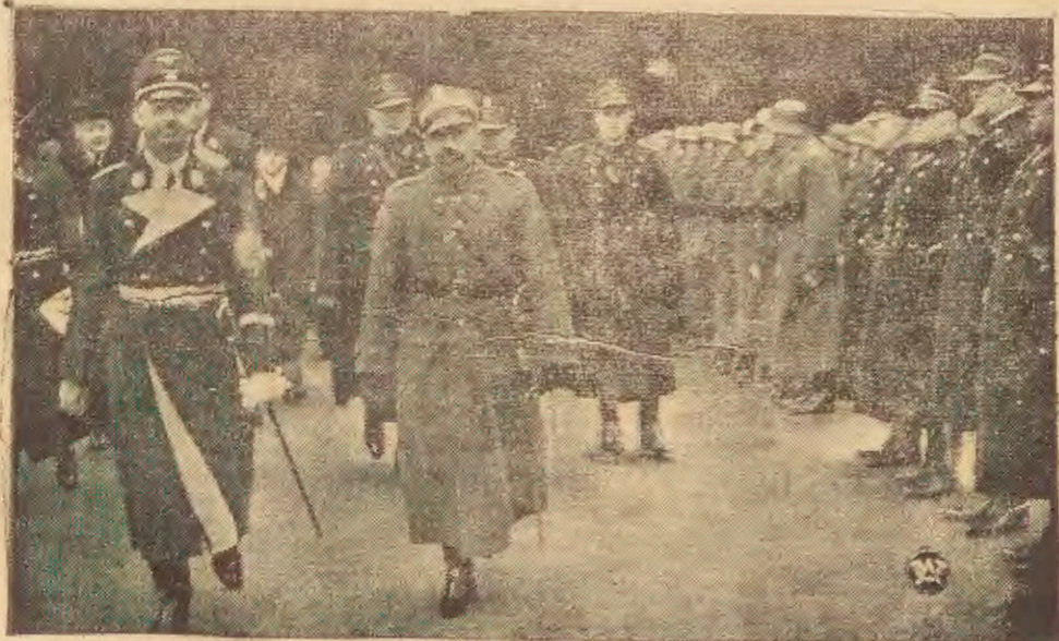
Dnia 18 lutego przybył do Warszawy szef policji i sztafet ochronnych Rzeszy — H. Himmler. Powitali go na dworcu przedstawiciele polskiej P. P. z komend. główn. gen. Zamorskim na czele, ambasador niem. von Moltke i przedstawiciele M. S. Z.

ciu i twórczości wielkich filozofów. Opowiada nie tylko popularnie i przystępnie, ale tak interesująco, że od książki tej nie można się oderwać. W dwóch pięknie ilustrowanych tomach, które powinny znaleźć się w każdej bibliotece, poznajemy życie filozofów od Sokratesa począwszy, aż na Bergsenie skończywszy. (kontynent).