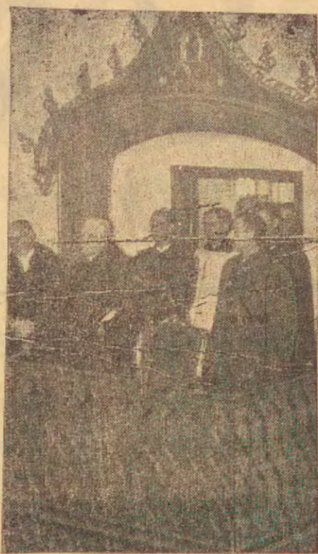
Pan Prezydent R. P. w swej łozy w katedrze warsz. podczas uroczystego nabożeństwa za duszę śp. Ojca św.

Jakiś wrzask nagle przerwał mój sen. Obudziłam się i zrozumiałam przyczynę: oto bitwa wrzała tuż naokoło mnie. Struchlałam, bo kule niby pszczoły, fruwały mi koło głowy, ale więcej aniżeli świst kul przerażała mnie myśl, że mój Muringo znajduje się pomiędzy walczącymi. Chciałam powstać, ale nie mogłam; chciałam krzyknąć, ale głos zamarł mi w piersi. Wyraźnie widziałam z pomiędzy gałęzi krzaka strony walczące. Widziałam was panie