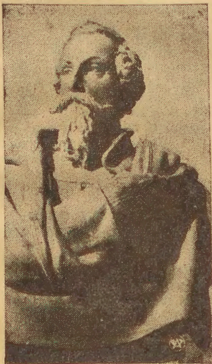
Pomnik bohaterskiego pułkownika Francesco Nullo, ofiarowany Warszawie przez miasto Bergamo.

Warszawa. W kołach politycznych obiegają pogłoski o możliwości wprowadzenia na widownię publiczną ponownie b. min. i b. premiera Jędrzejewicza, z którym przeprowadzono rozmowy w sprawie postawy ciał naukowych i wyższych uczelni.