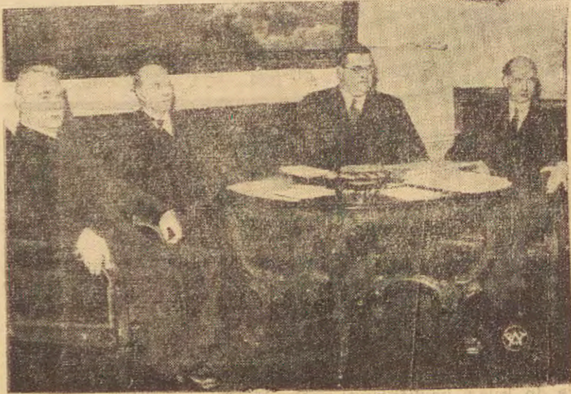
Konferencja ministrów Spraw Zagranicznych Państw Północnych, która ostatnio odbyła się w stolicy Finlandii w Helsinkach.

poblizu grobu Piusa X-go, który pochodził z rodziny kardynalskiej. Tłumy, które będą przychodzić, aby modlić się u ich grobów pomodlą się mejmy nadzieją i za duszę ich następcy“.