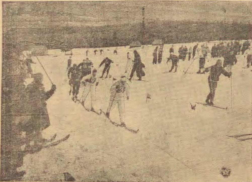
Fragment ze startu sztafet na ostatnich mistrzostwach narciarskich w Zakopanem.

Tak, to prawda. W niemieckim sporcie karność jest wielka, wyniki dlatego są wspaniałe. Ale i opieka zawodnikami jest lepsza niż u nas. Musimy się jeszcze uczyć.