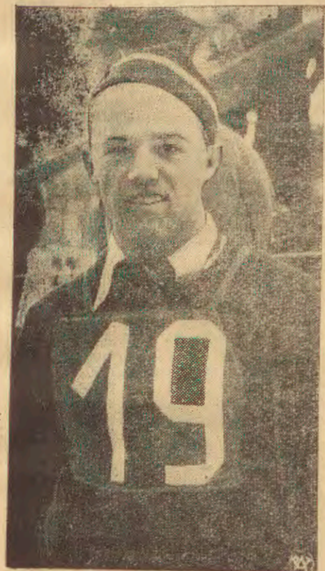
Z OSTATNIEGO DNIA F. I. S.-u

Mistrz świata w konkursie skoków otwartych Bradl Józef (Niemcy).