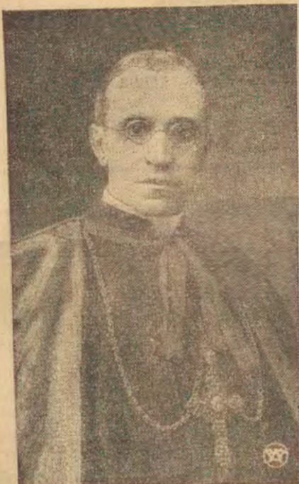
WYBRANY WCZORAJ PAPIEŻ PIUS XII.

nych i który podjęli sprawozdawcy radiowi ze wszystkich większych krajów katolickich. Kilkakrotnie dał się słyszeć transmitowany przez radiostację watykańską głos speakera polskiego, najpierw zzywający wszystkie radiostacje Polskiego Radia do połączenia się z radiostacją watykańską, a potem zwie-