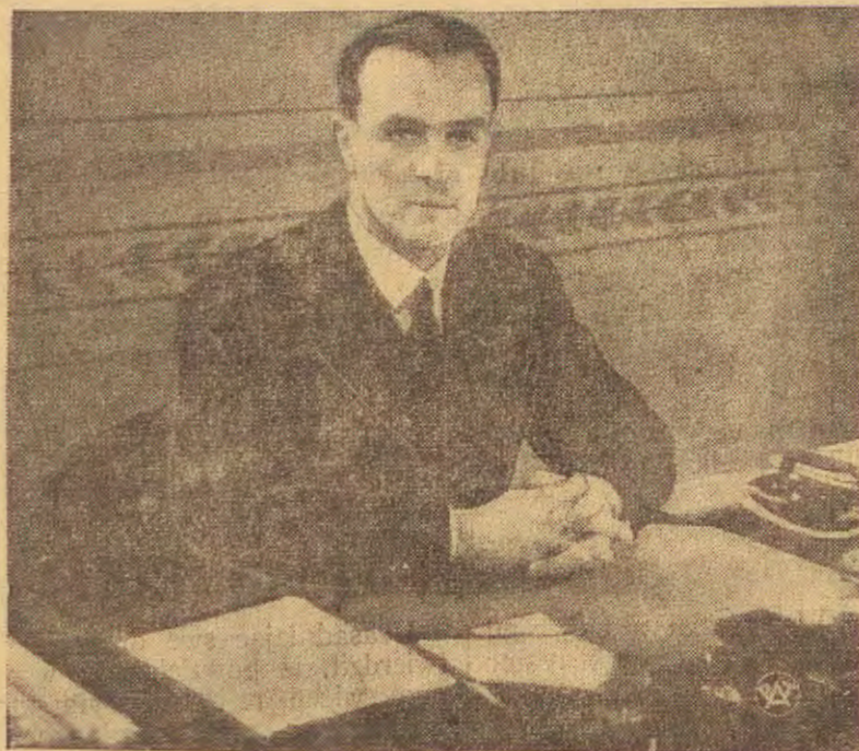
Minister Spraw Zagranicznych Królestwa Rumunii, p. Grzegorz Gafencu.

Wieczorem min. Beck podejmował min. Gafencu obiadem, podczas którego wygłoszono serdecznie przemówienie.