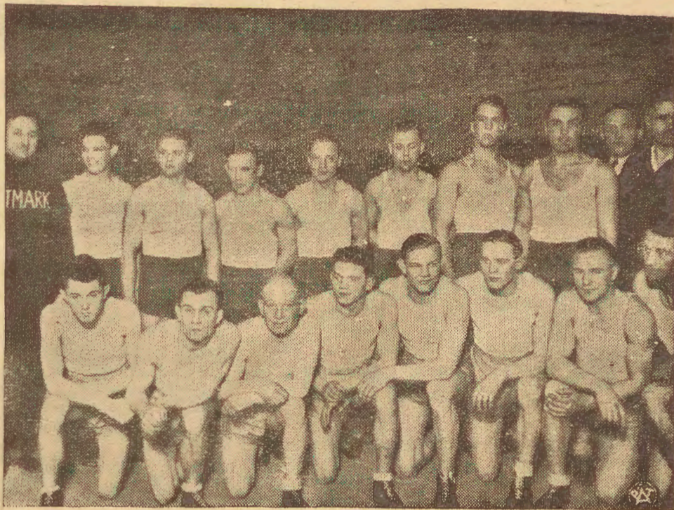
W dniu 7 marca odbył się w Katowicach mecz bokserski między reprezentacjami Śląska i Wiednia, zakończony zwycięstwem drużyny śląskiej 11:5. Na zdjęciu obie drużyny reprezentacyjne Wiednia i reprezent. Śląska.

wanie dzisiejszej młodzieży sportem — to nuta, jest pożyteczna dla jednostki narodu i państwa. W budzenie pracownia — sportowca musi się znaleźć czas na odrobienie lekcji, na czytanie lektury, i dzieł przeszłości i na... — F.