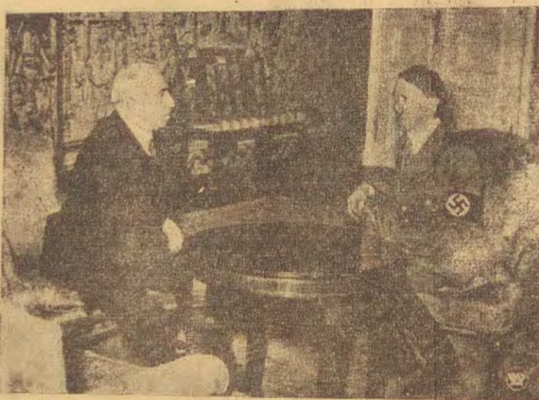
Kancelarz Hitler, w rozmowie z prezydentem Hacha na zamku praskim na Hradczynie

prezydentowi Rooseveltowi jak największej swobody działania i do ułatwienia mu przyjęcia z pomocą narodom europejskim.