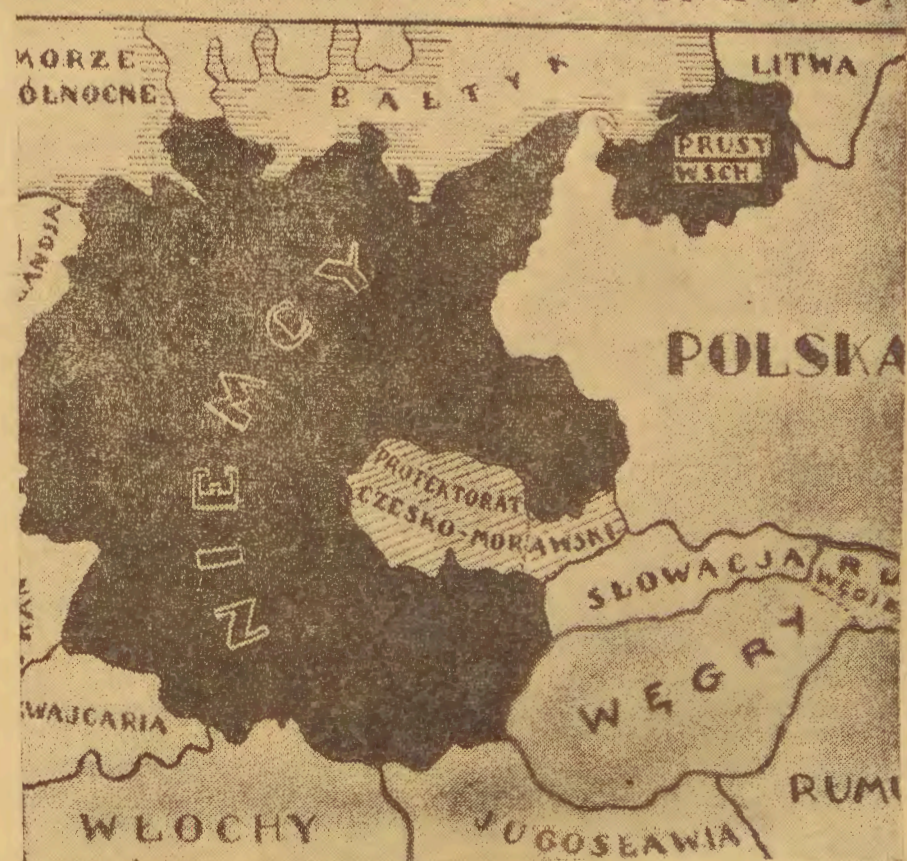
MAPA EUROPY ŚRODKOWEJ PO WYDARZENIACH OSTATNICH DNI