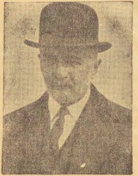
Zmarły tragicznie Walery Sławek.

Na innym miejscu „Osservatore Romano“ ogłasza artykuł z Warszawy na temat polskich zagadnień kolonialnych.