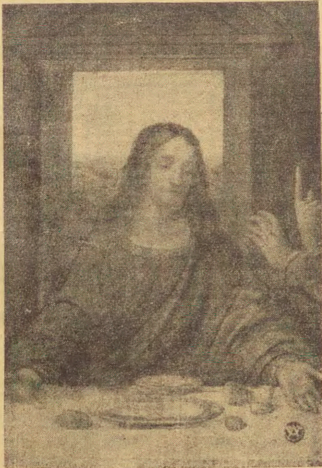
Fragment z „Ostatniej Wieczerzy” słynnego dzieła Leonardo de Vinci.

Otóż dlatego, że w tych dniach tygodnia Kościół w swej liturgii rozważa i czci ważne wydarzenia z ostatnich dni życia Chrystusa P. na ziemi.