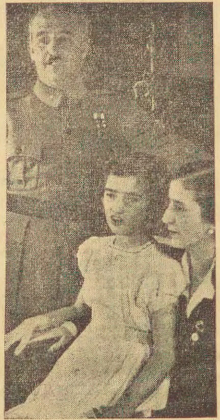
Szef państwa hiszpańskiego i naczelny wódz zwycięskich wojsk gen. Francisco Franco wraz z małżonką i córką.

Zarządzenie to wywołało w Gdańsku liczne protesty.