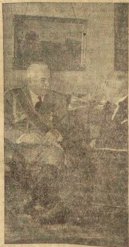
W dniu 5 bm. odbyła się w Pradze instalacja protektora Rzeszy von Neuratha. Na zdjęciu Neurath w rozmowie z prezydentem dr Hachą na zamku na Hradczynie.

Rzym. Minister Ciano powrócił tu samolotem z Tirany.