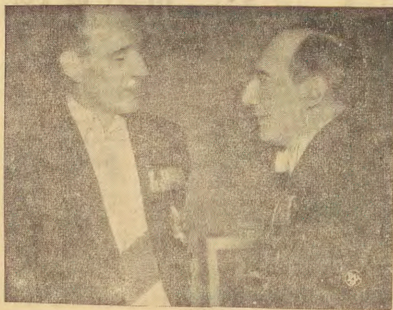
Na zdjęciu — minister Beck w rozmowie z Lordem Halifaxem, podczas przyjęcia w ambasadzie R. P. w Londynie w dniu 5 kwietnia, w godzinach wieczornych