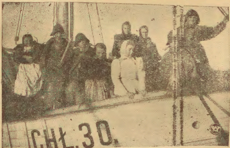
Rozpoczęcie wiosennych połowów fląder i łososi na morzu polskim stanowią jeden z najbardziej radosnych okresów.

ży, iż te materiały propagandowe są rozsyłane za pośrednictwem poczty polskiej, jako druki w otwartych kopertach.