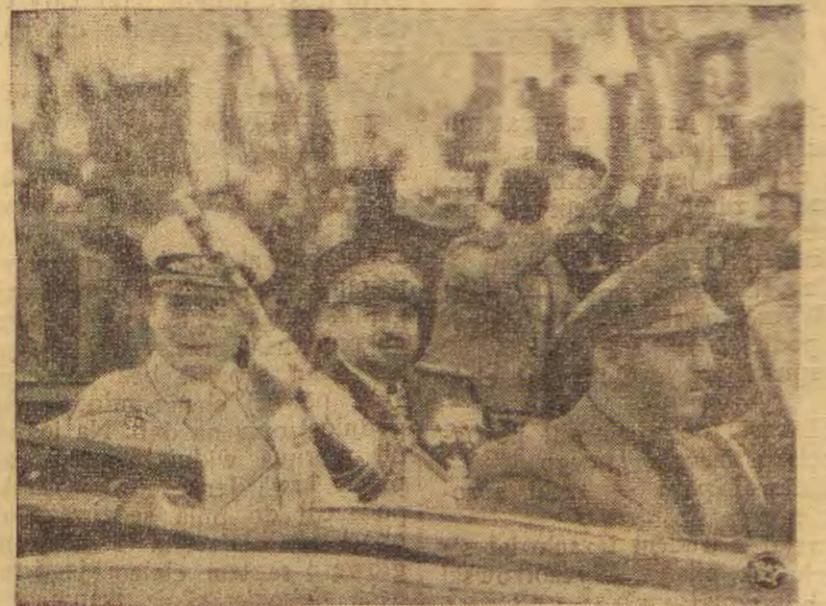
MARSZAŁEK BALBO I GOERING W TRIPOLISIE

„Tak długo, jak nie położymy ręki na rezerwach surowcowych i ludz-kich Europy wschodniej i południowo-wschodniej; póki nie możemy być cał-kiem pewni Włoch; i póki nie może-my oczekiwać ze strony Polski przy-najmniej życziwej neutralności, tak dłu-go nie możemy zaryzykować wojny“.