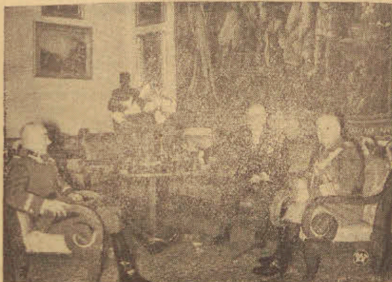
Marszałek Smigły Rydz, Pan Prezydent Rzeczypospolitej i gen. Laidoner w rozmowie na zamku Warszawskim.

„Jeśli inne państwa odstąpią dobrowolnie to, co zabrały sobie metodami gwałtu prowadzonymi od r. 1800“ (!!). Wreszcie kończy „12 Uhr Blatt“: „Uważamy raz na zawsze za najpewniejsze przystępować z odbezpieczonym rewolwerem do stołu konferencyjnego“.