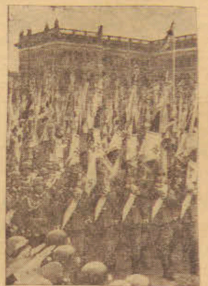
Przemarsz formacji wojskowych ze sztandarami przed kancl. Hitlerem.

Berlin. W telegramie, wystosowanym do Hitlera z okazji 50-tej rocznicy urodzin kanclerza, Mussolini oświadcza, że wrogowie Niemiec i Włoch nigdy nie będą w stanie zniszczyć osi berlińsko-rzymskiej.