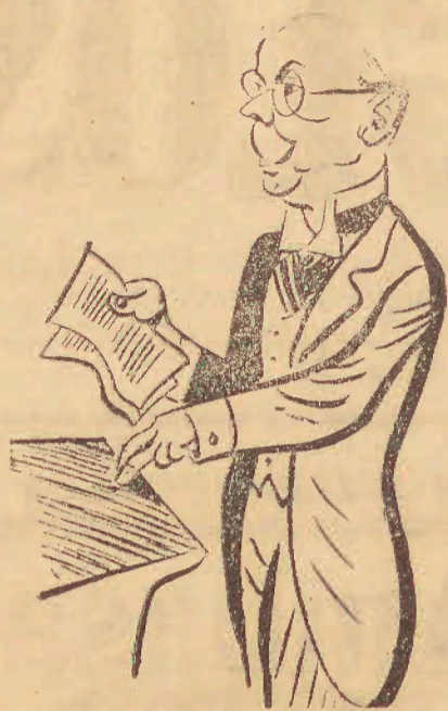
Dr Chwałkovsky min. spraw zagraniczn. Czech „pod protektoratem“.

Obecnie Forster wygłaszając przemówienie na zebraniu robotniczym stwierdził, że w czasie ostatniej bytności Hitler zapewnił go, iż sprawa włączenia Gdańska zostanie załatwioną jeszcze w tym roku.