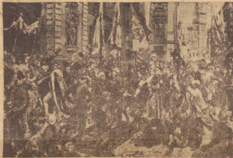
Jan Matejko: „Uroczysty pochód posłów Sejmu z Zamku do Katedry Św. Jana na dziękczynne nabożeństwo, po uchwaleniu konstytucji 3 Maja 1791 r.

Fascynująca fabuła i intryga spowodują, że każdy odcinek naszej powieści oczekiwany będzie z niecierpliwością.