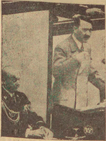
Kanclerz Hitler podczas przemówienia piątkowego w Reichstagu