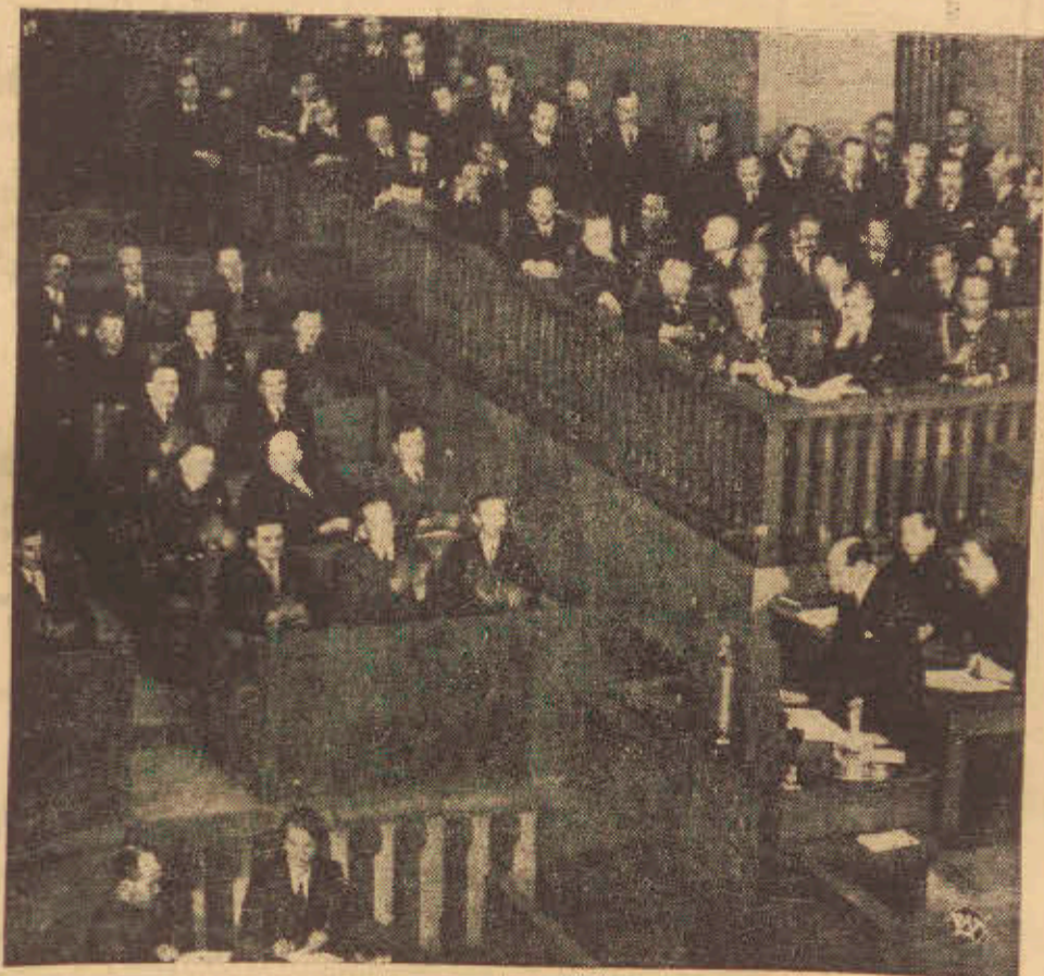
WIELKA PIĄTKOWA MOWA MIN. BECKA