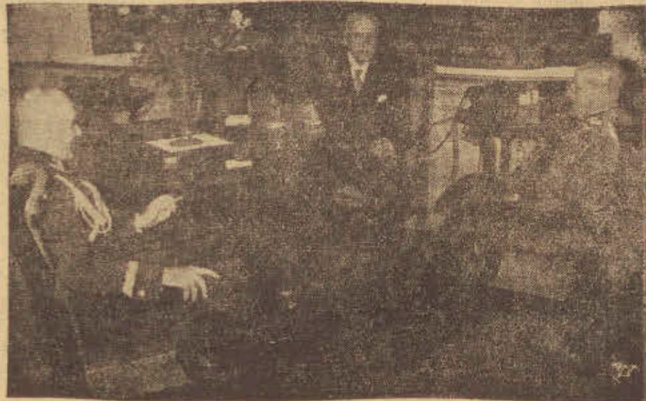
Moment z audjencji gen. Rasztkisa w towarzystwie Marsz. Smigłego-Rydzka, u Pana Prezydenta R. P. na Zamku Królewskim w Warszawie.

W kołach niemieckich twierdzą, że zajście rzekomo sprowokowali agitatorzy.