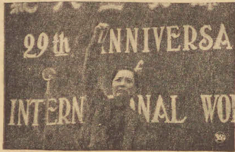
Pani Czang-Kai-Szek w momencie wygłaszania płomiennego przemówienia na kongresie kobiet w Czungking,

Ze szczątków samolotu wydobyto 4 karabiny maszynowe, rozbity aparat do zdjęć lotniczych oraz resztki rozbitej radiostacji.