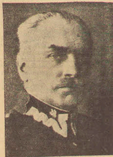
3 lata na stanowisku premiera W dniu 15 maja br. upłynęło 3-lecie urzędowania p. premiera Sławoja Składkowskiego na stanowisku premiera.