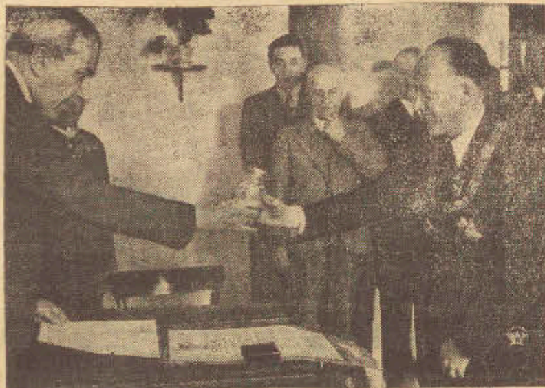
W dniu 3 maja w godzinach południowych przybyło na lotnisko Mokotowskie w Warszawie 6 samolotów, biorących udział w harcercyjskiej sztafecie lotniczej. — Na zdjęciu: Wreczanie Panu Prezydentowi R. P. adresów holdowniczych przez harcercyjską sztafetę lotniczą. — W Sztokholmie odbyła się konferencja ministrów Spraw Zagranicznych Państw Skandynawskich. Przedmiotem obrad konferencji była propozycja rządu Rzeszy zawarcia układów o nieagresji z wymienionymi państwami.