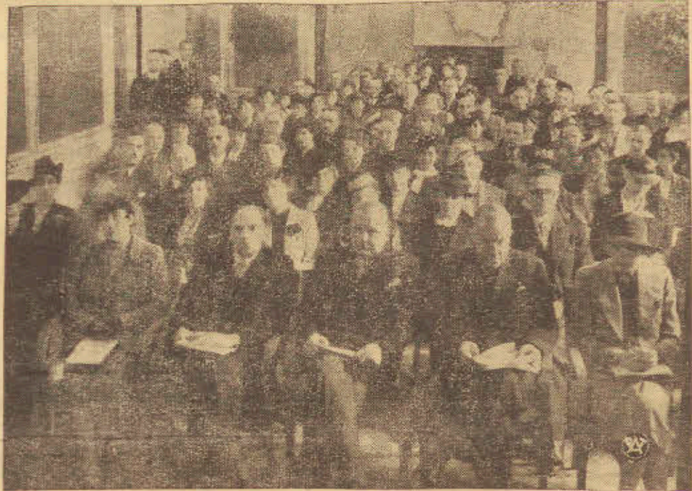
Rzut oka na plenarne obrady Zjazdu Delegatów Rodziny Urzędniczej z całej Rzeczypospolitej, które odbyły się w dniu 20 maja w Warszawie. W pierwszym rzędzie w środku siedzi min. Poczt i Telegrafów Kaliński.