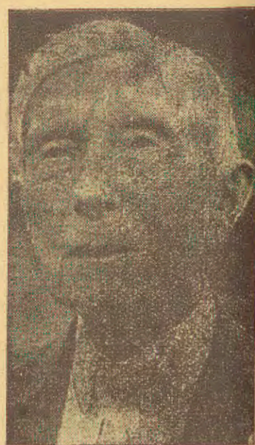
Zmarły John Dawson Rockefeller w wieku 98 lat. Na zdjęciu naszym reproduujemy jedno z ostat. zdjęć „króla nafty”.

Warszawa. — 6,15 Audycja poranna. 11,30 Audycja dla szkół. 12,15 „Zgoda buduje — niezgoda rujnuje” — pogadanka. 12,25 Pół godziny pogodnej muzyki. 16,00 „Wśród włoskich polonofilów” — szkic literacki. 16,15 Serenady. 17,00 Reportaż