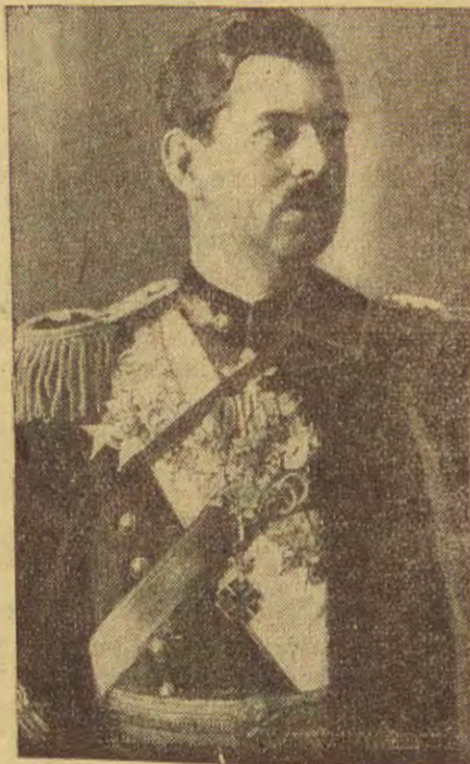
Król Karol II.

Wśród głośniejszych okrzyków tysięcy tłumów, zgromadzonych na ulicach stolicy, wiwatujących na cześć P. Prezydenta, wśród szpalerów wojsk, prezentujących broń. P. Prezydent R. P. i król Karol przybywają do pałacu