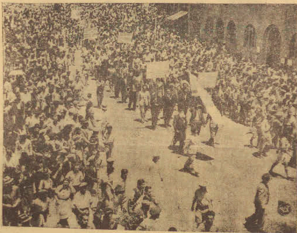
Po ogłoszeniu przez Anglię t. zw. „Białej Księgi“ z projektem rozwiązania zagadnienia palestyńskiego, na podstawie którego po okresie przejściowym, zostało by stworzone niepodległe państwo arabskie, wybuchły w większych miastach Palestyny. Na zdjęciu fragment z demonstracji żydowskiej w Jerozolimie, po ogłoszeniu przez Anglię „Białej Księgi“.

Możemy być zobowiązani Włochom za ujawnienie zamiarów sojusznika berlińskiego, a na wynurzenia „Il Telegrafo“ odpowiedzieć krótko: Niedoczekanie wasze!