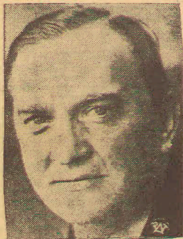
Prof. dr. Stefan Banach, prof. Uniwersytetu Jana Kazimierza we Lwowie, laureat najwyższej nagrody naukowej Polskiej Akademii Umiejętności.

Podkreśla się w Londynie, że polityka brytyjska na Dalekim Wschodzie nie może ulec żadnej zmianie, równałoby się to bowiem całkowitej utracie prestiżu Wielkiej Brytanii.