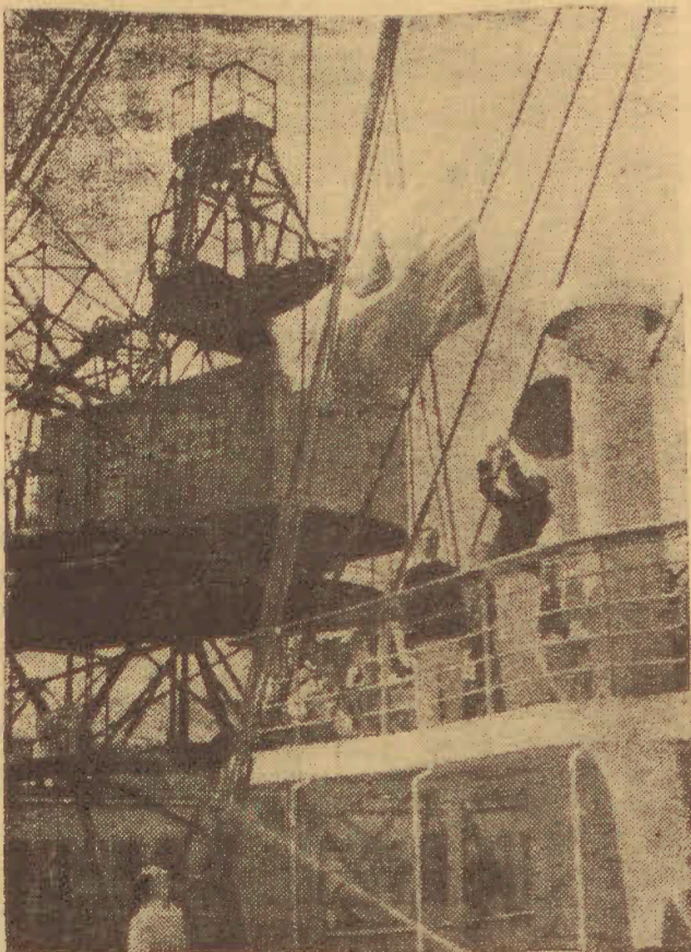
Na lewo: Nowy polski transatlantyk „Sobieski”. Na zdjęciu moment wciągnięcia bandery podczas uroczystości chrztu M. S. „Sobieskiego” w Gdyni.

Sven Hedin odniósł poważne obra- żenia twarzy i został przewieziony do szpitala.