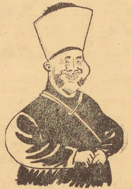
Wielki Mufti Jerozolimski (Hai Amin al Hussein)

Wśród tej rozmowy oznajmiono Moszyńskiego, którego król wpuścić kazał. Wszedł pan podskarbi i zbliżył się do ręki królewskiej. Cały był ubrany za-