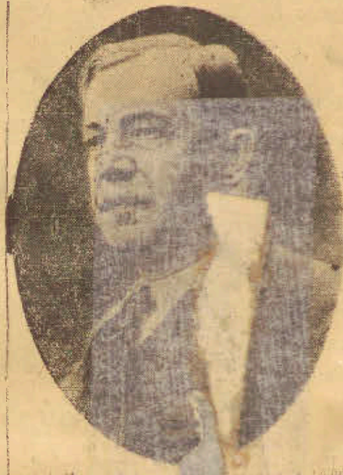
Sp. Wojciech Korfanteo

z przyjaciół Zmarłego ogłosił ostatnią prośbę umierającego Korfanteo do