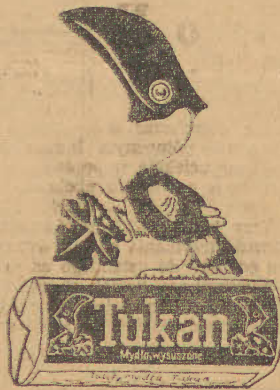
Wysuszone mydło „Tukan” w paczkach po 500 gramów

Za to złoczyńcy, którzy początkowo zdradzali chęć do odwrotu, rychło zorientowali się, że ukryci za belami towarów niewidzialni wrogowie są niebezpieczni i słabo zaopatrzeni w naboje. Strzały opryszków były coraz częstsze, gdyż nawet lekko ranni rabusie poszukiwali się bronią. Napastnicy utworzyli półkole, które stopniowo zacieśniało się. Jeżeli dojdzie do walki wręcz, obaj dzielni policjanci będą zgubieni.