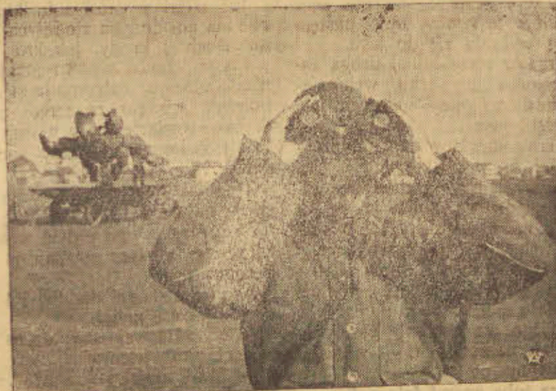
Posterek obserwacji obrony przeciwlotniczej

nom. W kołach politycznych Bukaresztu mówi się, że zawierając ostatni układ z Berlinem, Rumunia czyniła jak najdalej idące ustępstwa. Każde nowe żądanie niemieckie spotka się ze zdecydowaną odmową. Wszelkie próby ingerencji niemieckiej w wewnętrzne sprawy Rumunii spotkają się z energicznym oporem.