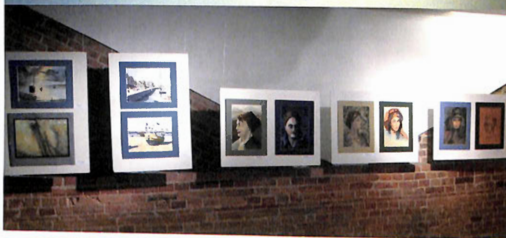
Wernisaż wystawy KONFRONTACJE 2017 – Galeria w Ratuszu