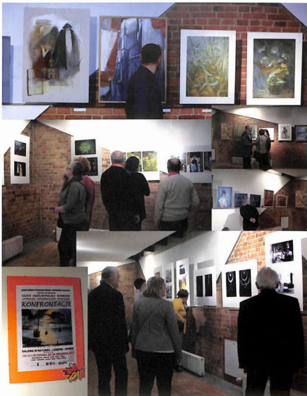
Wernisaż wystawy KONFRONTACJE 2017 – Galeria w Ratuszu