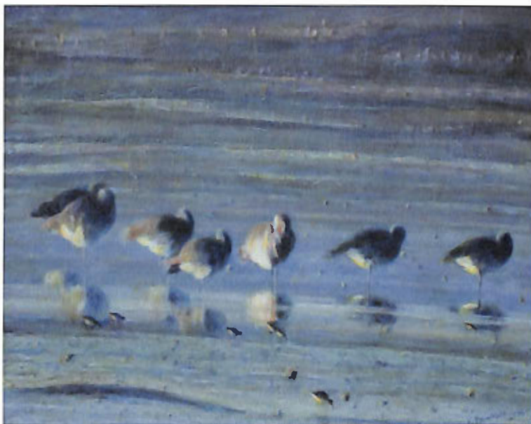
„W świetle poranka” – akryl, 40x50