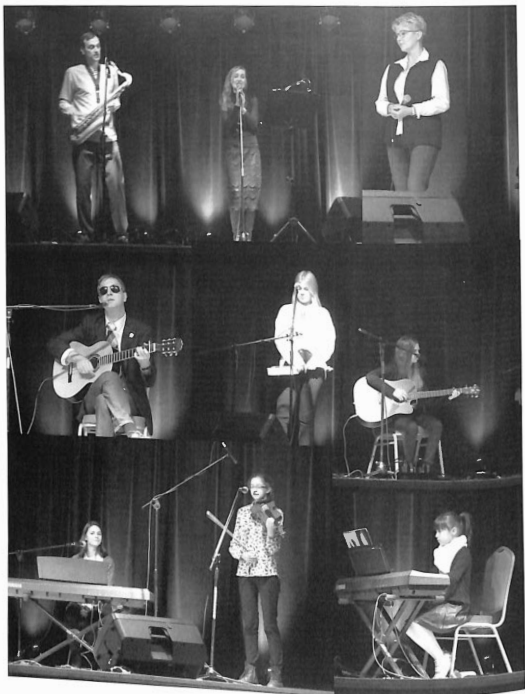
Festiwal Muzyki i Piosenki Autorskiej