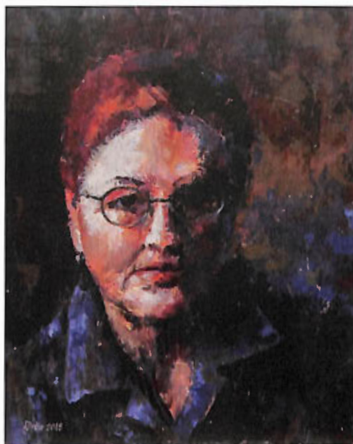
z cyklu „Auto...”: „Odsłona I” – akryl, 50x40