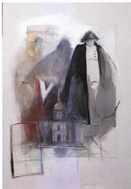
„Wielki Symbol” – technika mieszana, 70x100