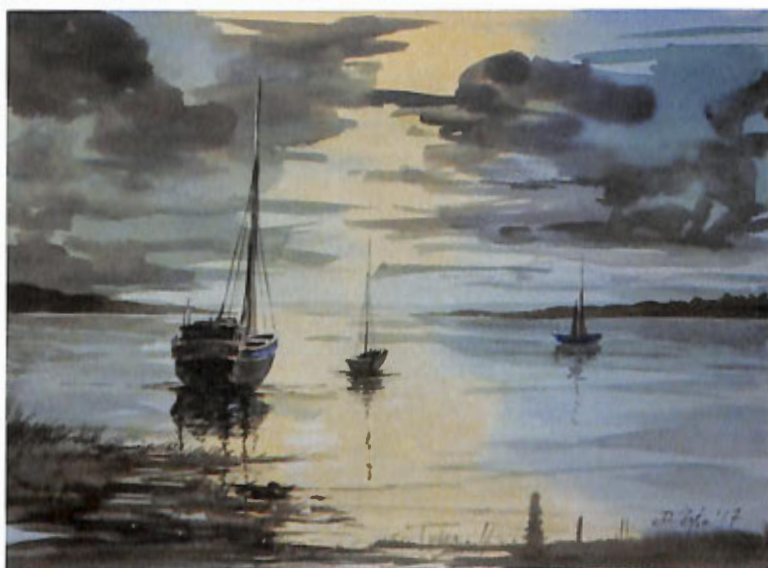
„Cisza po burzy” – akwarela, 30x40