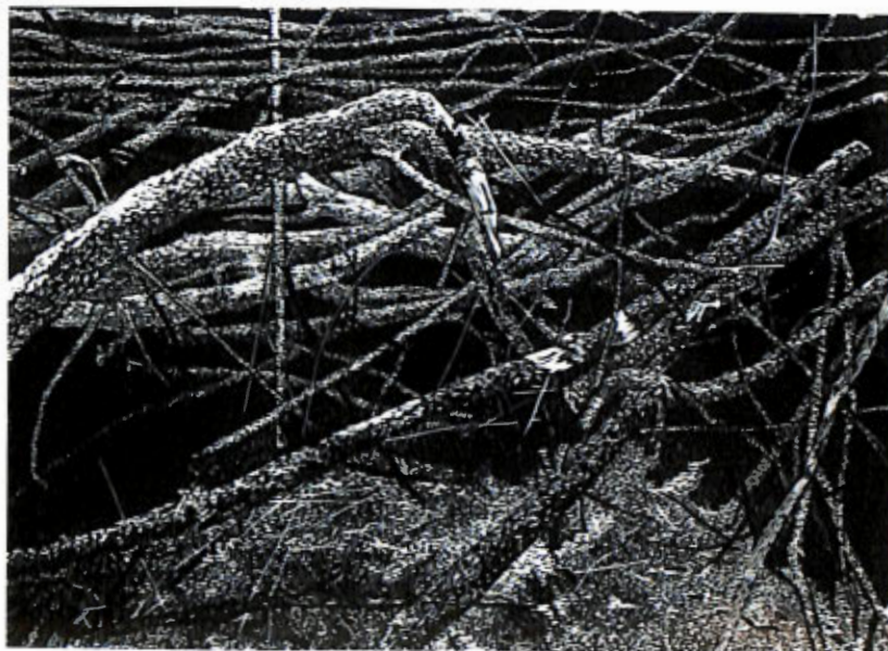
„Wyrzucona na brzeg” – linoryt, 40x50