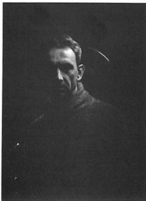
z cyklu „Po drugiej stronie szkła” – „Na zawsze”