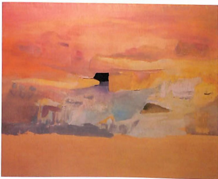
„Shadows of birch I” – akwarela, 80x100