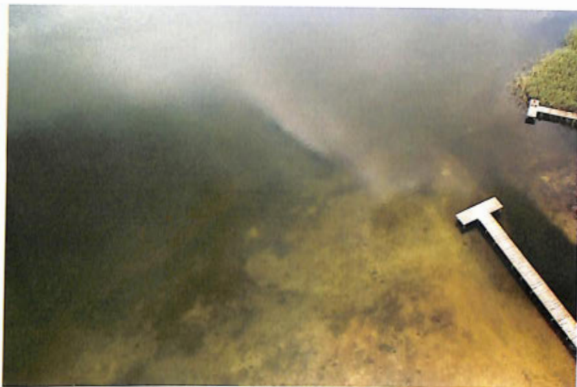
„Zamęty i odmęty”