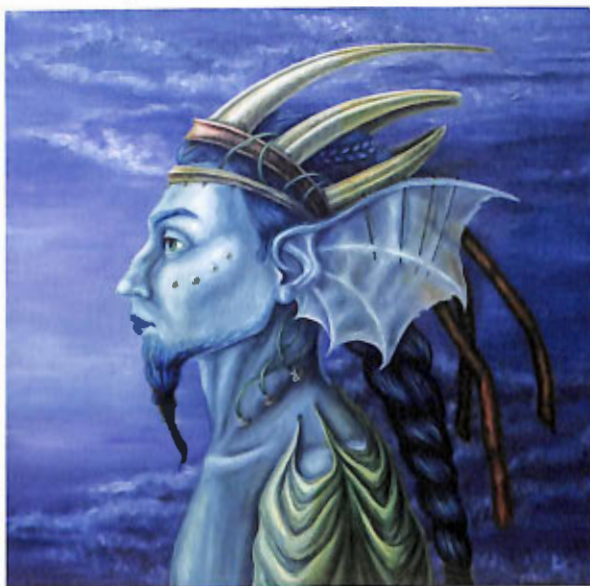
„Król” – olej, 50x50