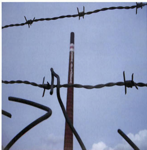
„Tyle zostało z Cukrowni Góra Śląska”