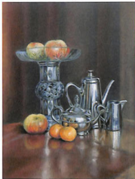
„Martwa natura” – pastel, 40x50