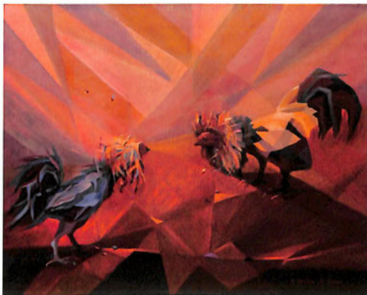
„Walczące Kogutki” – akryl, 40x50