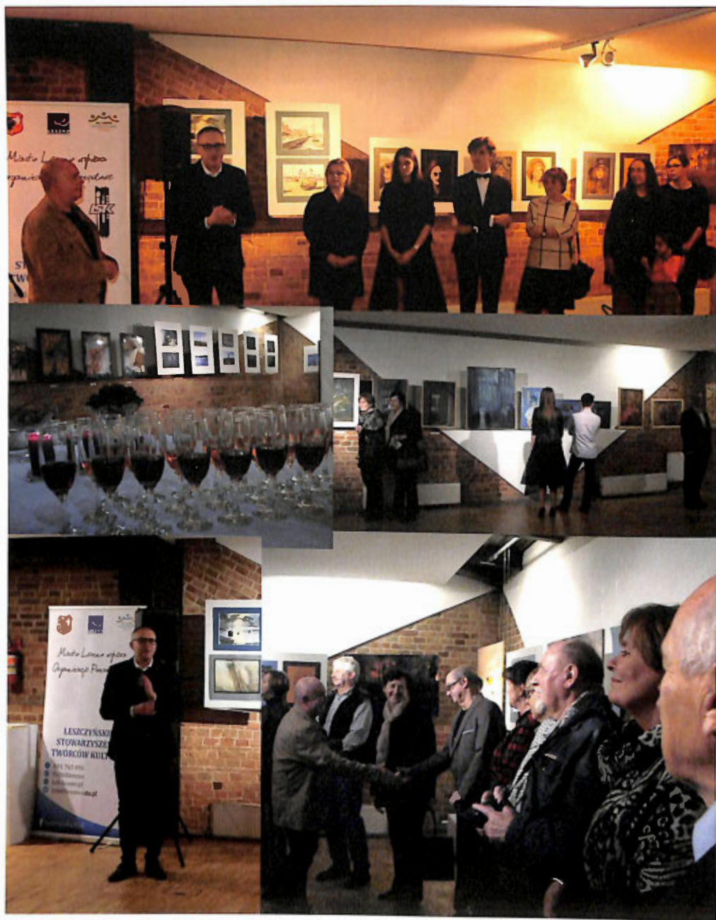
Wernisaż wystawy KONFRONTACJE 2017 – Galeria w Ratuszu