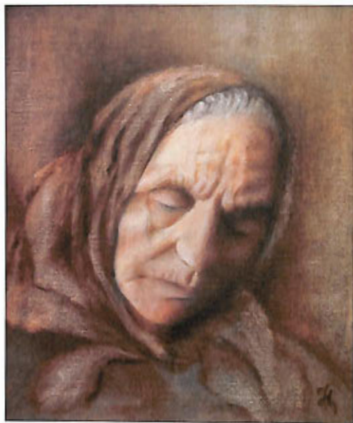
„Mater Dolorosa” – olej, 46x38