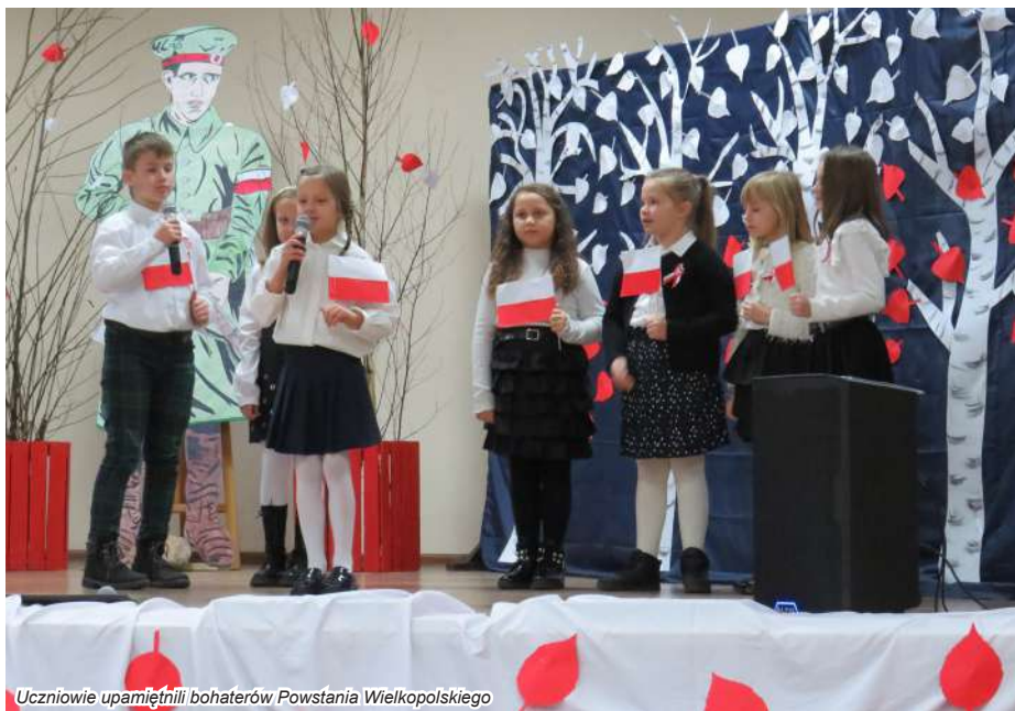
Uczniowie upamiętnili bohaterów Powstania Wielkopolskiego

Po oficjalnej części uczniowie i goście wzięli udział w akademii, podczas której przypomniano okoliczności wybuchu powstania oraz działania zbrojne na ziemiach miejskogóreckiej i krobskiej. Uczniowie szkoły podstawowej upamiętnili heroiczną walkę Wielkopolan podczas koncertu, wykonując dawne i współczesne utwory o