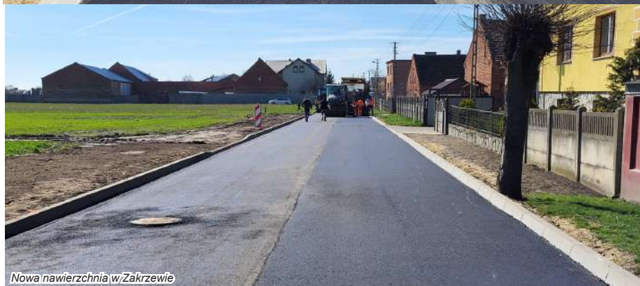
Nowa nawierzchnia w Zakrzewie