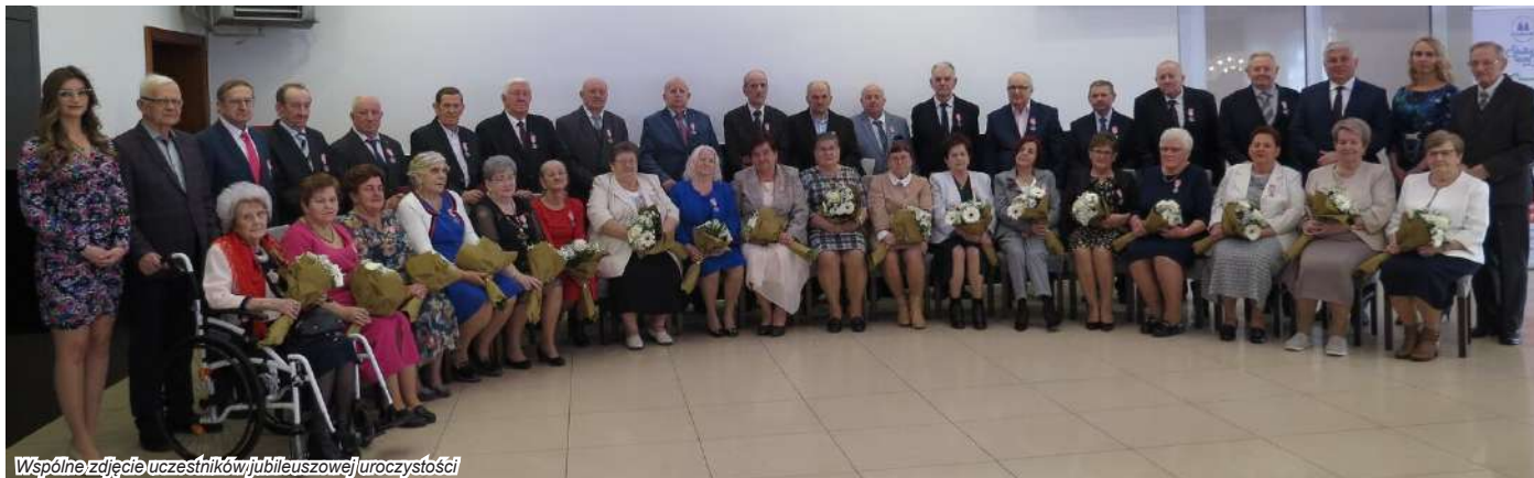
Wspólne zdjęcie uczestników jubileuszowej uroczystości

Niezwykłe miła i wzruszająca uroczystość odbyła się w miejskogóreckiej gminie 20 marca br. Tego dnia okolicznościowymi medalami uhonorowane zostały pary, które obchodziły pięćdziesiątą rocznicę ślubu.