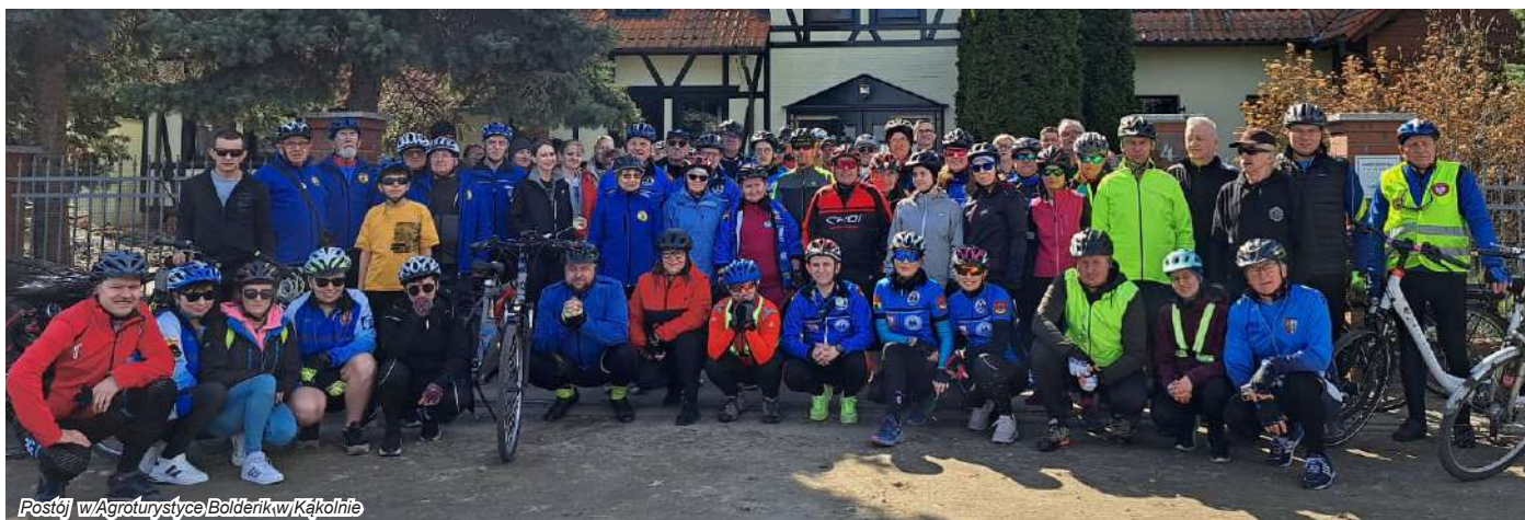
Postój w Agroturystyce Bolderik w Kąkolnie

Około siedemdziesięcioro miłośników turystyki na dwóch kółkach zainaugurowało sezon w Miejskiej Górcie, jak przystało na sympatyków tej formy aktywnego wypoczynku, udziałem w rajdzie „Pokręć na wiosnę z TRAMP-em”, który odbył się 16 marca br.