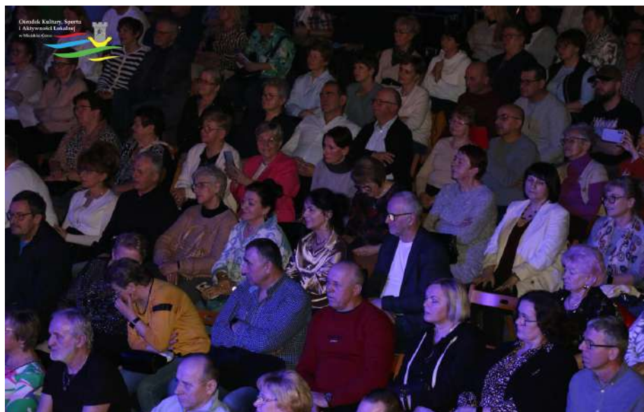
Koncert był dla zgromadzonej publiczności niezapomnianym przeżyciem

Krzysztofa Klenczona i Trzech Koron czy „Wszystko mi mówi, że mnie ktoś pokochał” z repertuaru Skaldów. Doskonale znane utwory porwały publiczność do śpiewu i tańca, tworząc atmosferę, w której można było się zrelaksować i po prostu dobrze bawić.