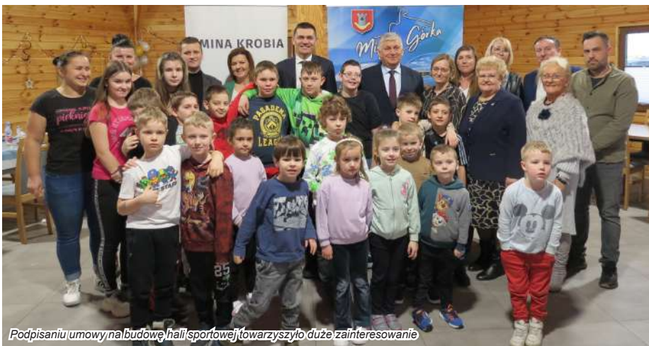
Podpisanie umowy na budowę hali sportowej towarzyszyło duże zainteresowanie

W ramach zadania wybudowana zostanie hala sportowa, mająca wymiary 24 m x 44 m, z polem gry (20 m x 40 m) o nawierzchni ze sztucznej trawy. Obok powstanie zaplecze: dwie szatnie z wężłami sanitarnymi (prysznic, wc), sanitariaty ogólnodostępne, magazyn na sprzęt spor-