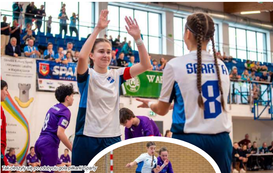
Tak cieszyły się po zdobyciu gola piłkarki Sparty

szedł na prowadzenie. Spartanki doprowadziły do wyrównania w drugiej połowie spotkania. Mecz w regulaminowym czasie zakończył się remisem 1:1. O awansie do finału zdecydowały rzuty karne, w których skuteczniejsze okazały się zawodniczki Warty, wygrywając 3:2. W walce o brąz piłkarki Sparty zmierzyły się z Medykiem Konin II. W tym pojedynku odniosły pewne i przekonujące zwycięstwo 4:0.