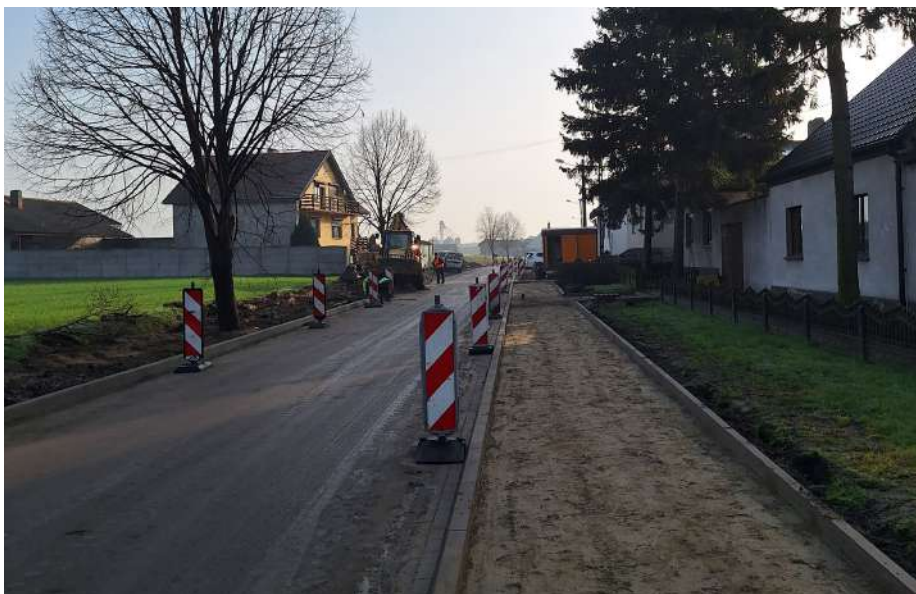
Budowa chodnika na ulicy Kościuszki w Dąbrowie