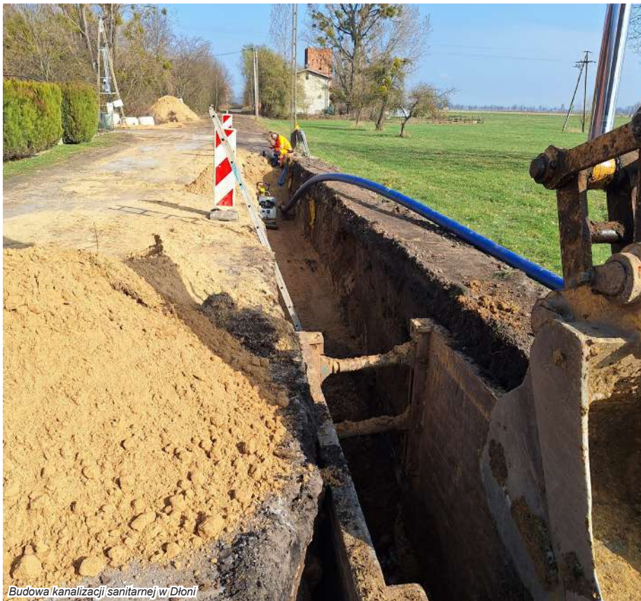
Budowa kanalizacji sanitarnej w Dłoni