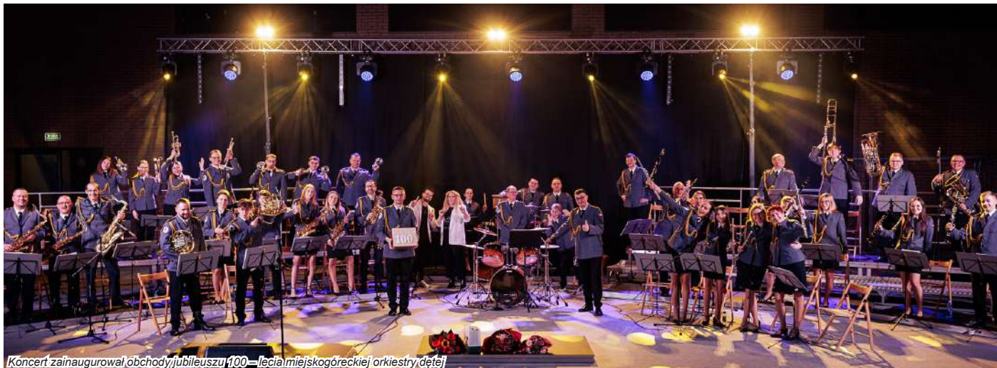
Koncert zainaugurował obchody jubileuszu 100 – lecia miejskogóreckiej orkiestry dętej

Nie brakowało głosów zachwytu po Koncercie Noworocznym miejskogóreckiej orkiestry dętej, który odbył się 11 lutego br. w wypełnionej po brzegi Hali Widowiskowo – Sportowej im. Powstańców Wielkopolskich. Wspaniały występ wywarł na publiczności duże wrażenie.