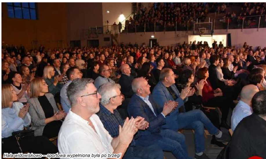
Hala widowiskowo – sportowa wypełniona była po brzegi