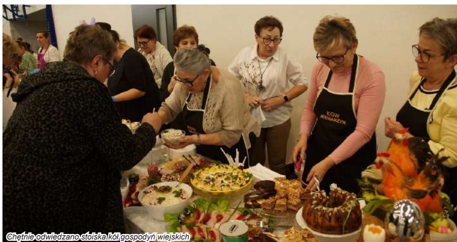
Chętnie odwiedzano stoiska kół gospodyń wiejskich

wiejskich. Nie zabrakło faszeryowanych jajek, wędlin, pasztetów, domowego żurku i słodkich mazurków. Uzupełnieniem kulinar-nych smaków była możliwość skosztowania świeżo mielonej kawy i gorącego kakao, które serwowała grupa rekonstrukcyjna Żarno.