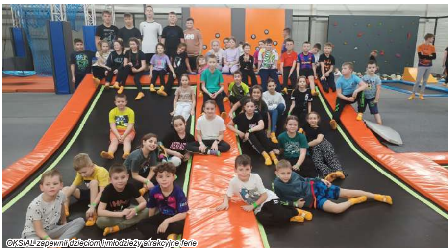
OKSiAL zapewnił dzieciom i młodzieży atrakcyjne ferie

Podczas ferii chętnie korzystano nie tylko z wyjazdowych propozycji, ale też z zajęć i zabaw zorganizowanych przez OKSiAL na miejscu, mających nie tylko rekreacyjny, ale również edukacyjny charakter. Uczestnictwo w warsztatach rękodzielniczych oraz animacjach pozwoliło na rozwinięcie kreatywności i zdolności manualnych, a obejrzenie spektaklu teatralnego wpłynęło na pobudzenie wyobraźni. Co więcej, dzieci mogły spędzić przyjemnie czas na dmuchałkach oraz laserowym paintbal-