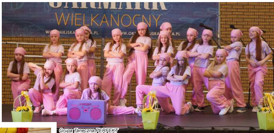
Grupa Taneczna PERFEKT