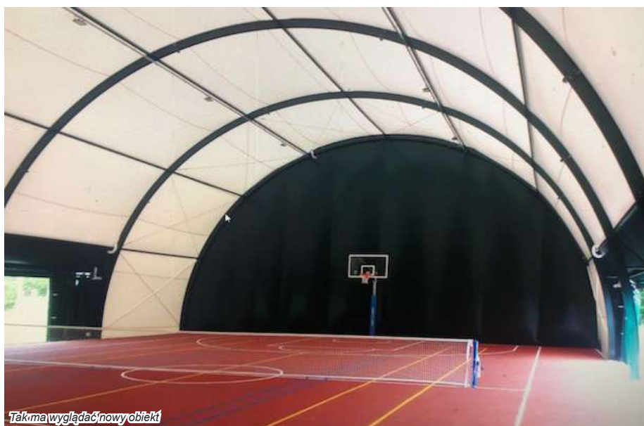
Tak ma wyglądać nowy obiekt

Obok powstanie zaplecze, w którym znajdą się dwie szatnie z węzłami sanitarnymi, magazynek na sprzęt sportowy, siedziba opiekuna obiektu i pomieszczenie techniczne. Obowiązkowym elementem wyposażenia ma być mobilna strzelnica laserowa. Hala służyć będzie przede wszystkim dzieciom i młodzieży podczas lekcji wychowania fizycznego.