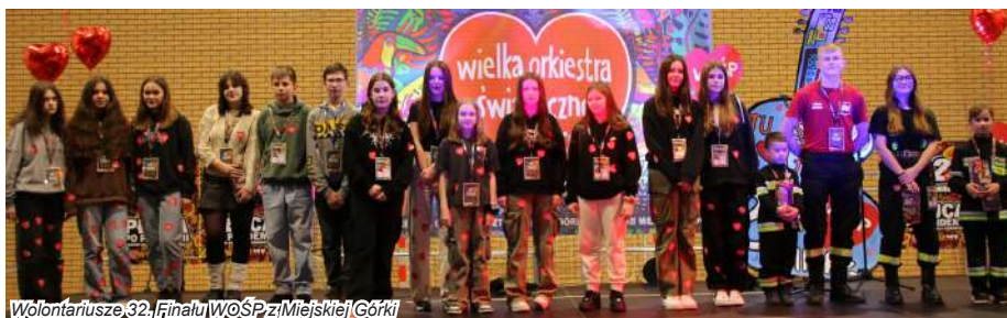
Wolontariusze 32. Finału WOŚP z Miejskiej Górkii

Wspólna zabawa rozpoczęła się od występów artystycznych. Jako pierwsze swoje umiejętności wokalne i taneczne zaprezentowały dzieci z miejscowych placówek oświatowych: Przedszkola w Miejskiej