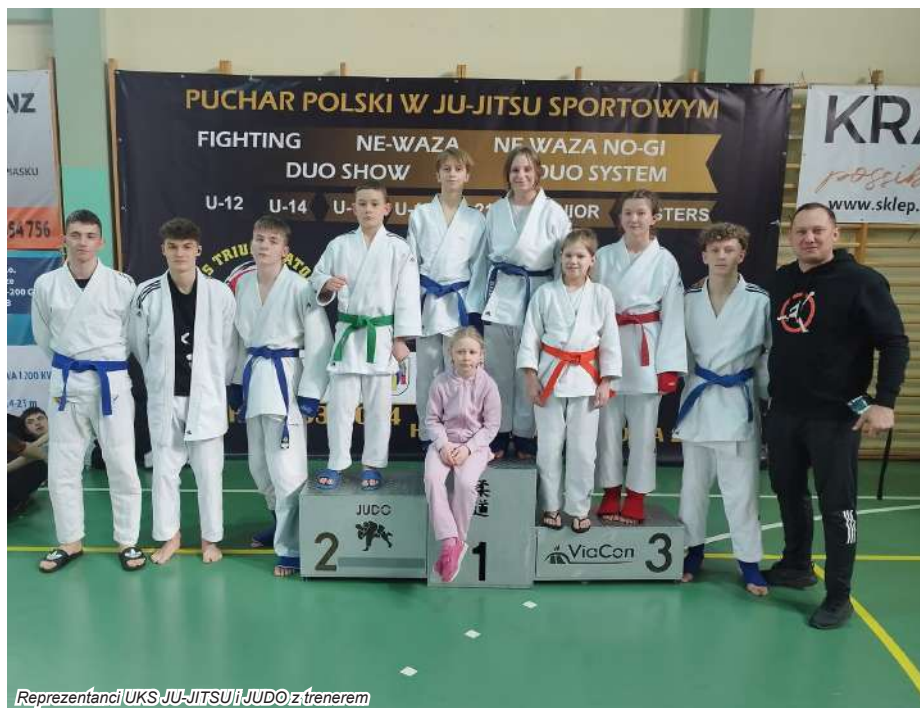
Reprezentanci UKS JU-JITSU i JUDO z trenerem