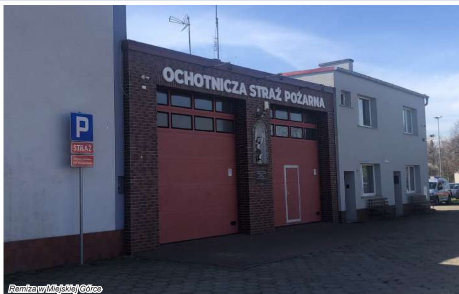
Remiza w Miejskiej Górcie