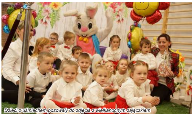
Dzieci z uśmiechem pozowały do zdjęcia z wielkanocnym zajączkiem

Dużym powodzeniem cieszyła się degustacja tradycyjnych i smakowitych potraw wielkanocnych, przygotowanych przez członkinie kół gospodyń