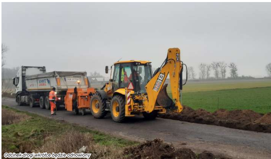
Odcinek drogi wkrótce będzie odnowiony

W marcu br. rozpoczął się remont drogi prowadzącej z Konar do Piasków. Wykonawcą robót jest firma STRABAG z Pruszkowa.