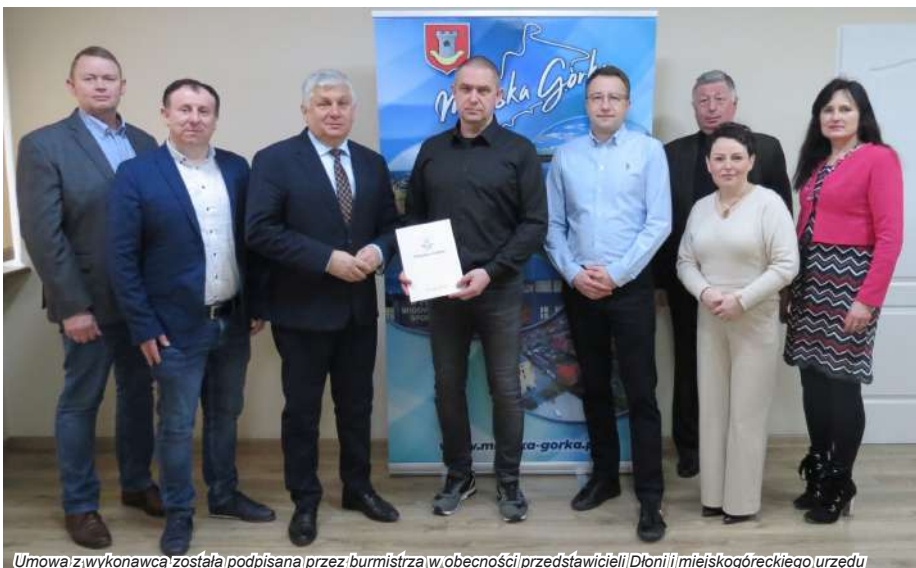
Umowa z wykonawcą została podpisana przez burmistrza w obecności przedstawicieli Dłoni i miejskogóreckiego urzędu