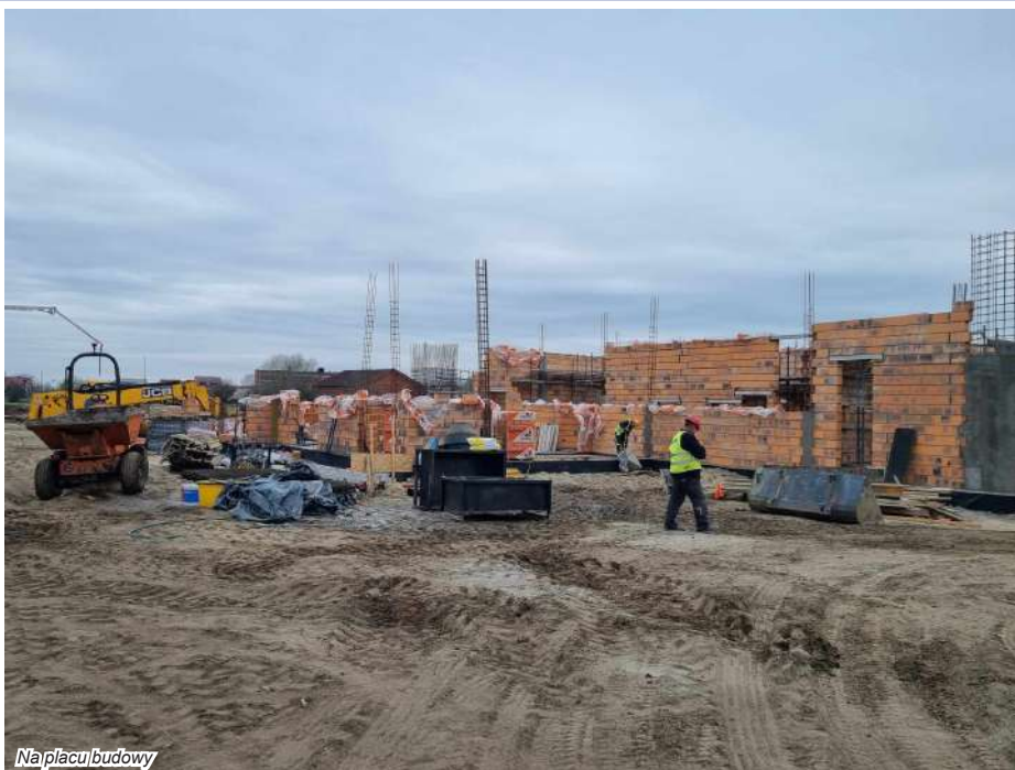
Na placu budowy