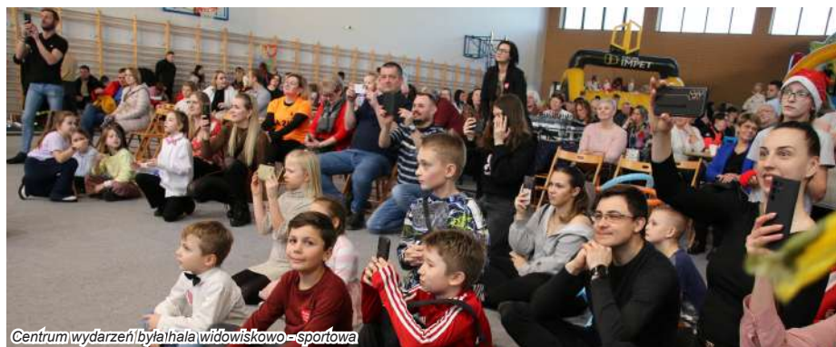
Centrum wydarzeń była hala widowiskowo-sportowa