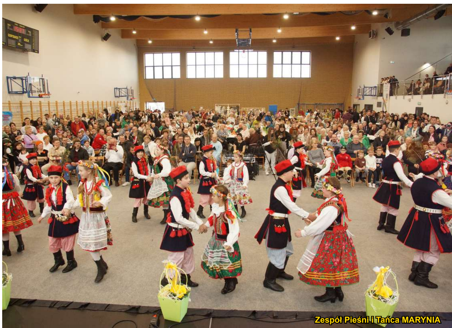
Zespół Pieśni i Tańca MARYNIA