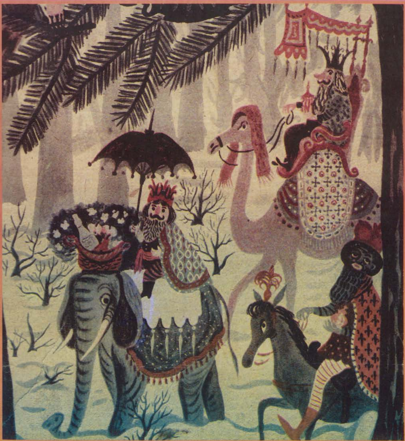
Na okładce: rysunek Olgi Siemaszkowej

MIESIĘCZNIK INFORMACYJNO - SPOŁECZNO - KULTURALNY GMINNEGO OŚRODKA KULTURY WE WŁOSZAKOWICACH