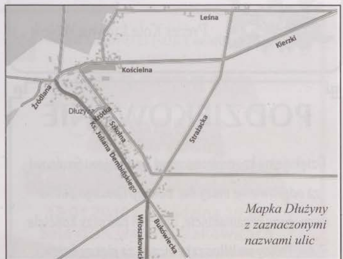
Mapka Dłużyny z zaznaczonymi nazwami ulic